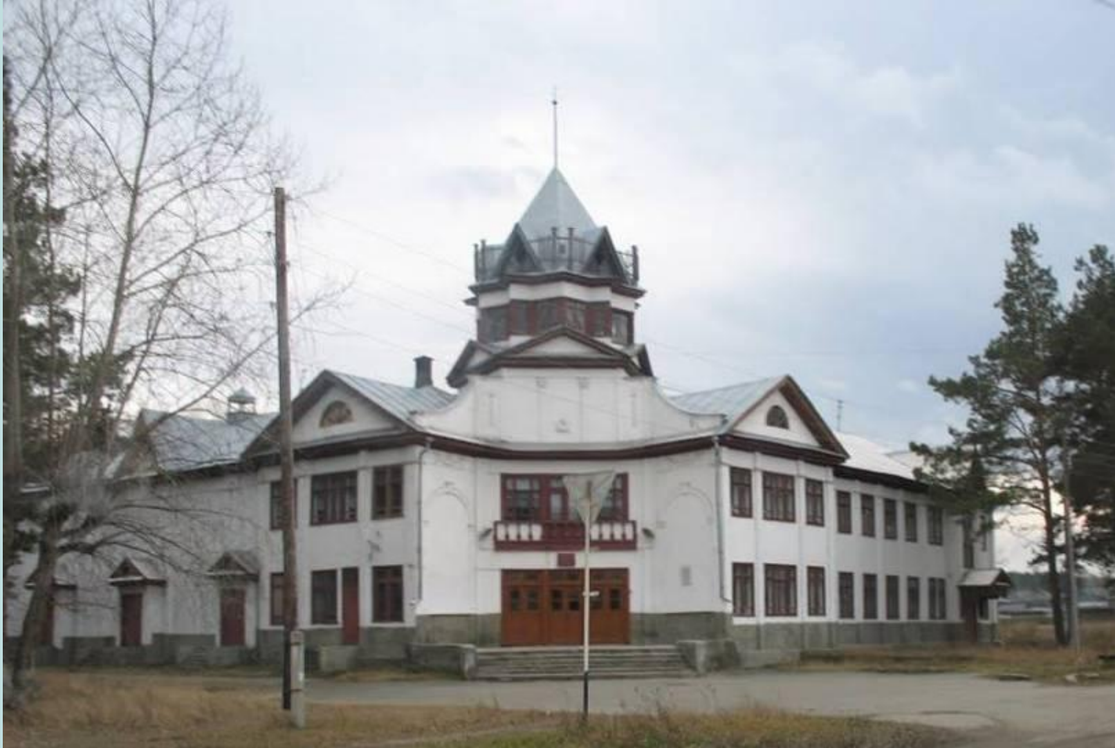
быв. Тавдинский Дом пионеров им. Павлика Морозова (клуб имени Ф.Э. Дзержинского)