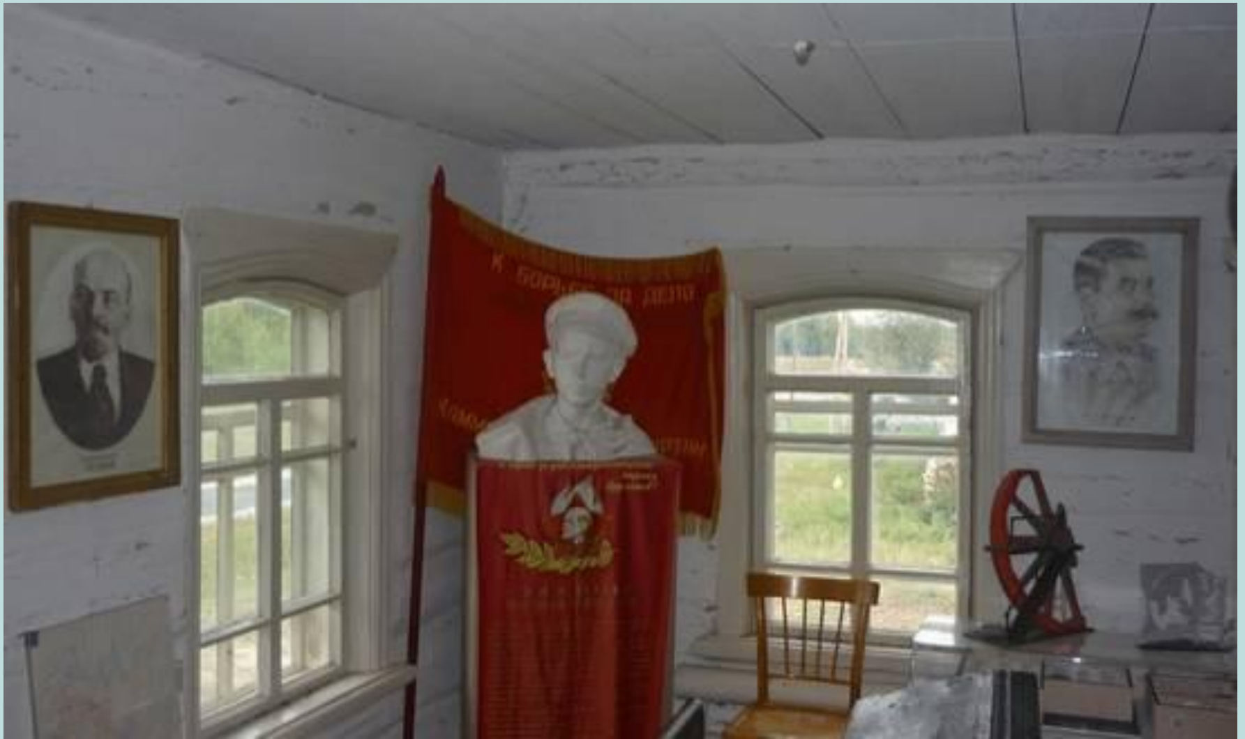
Тавдинский район, Герасимовка, музей