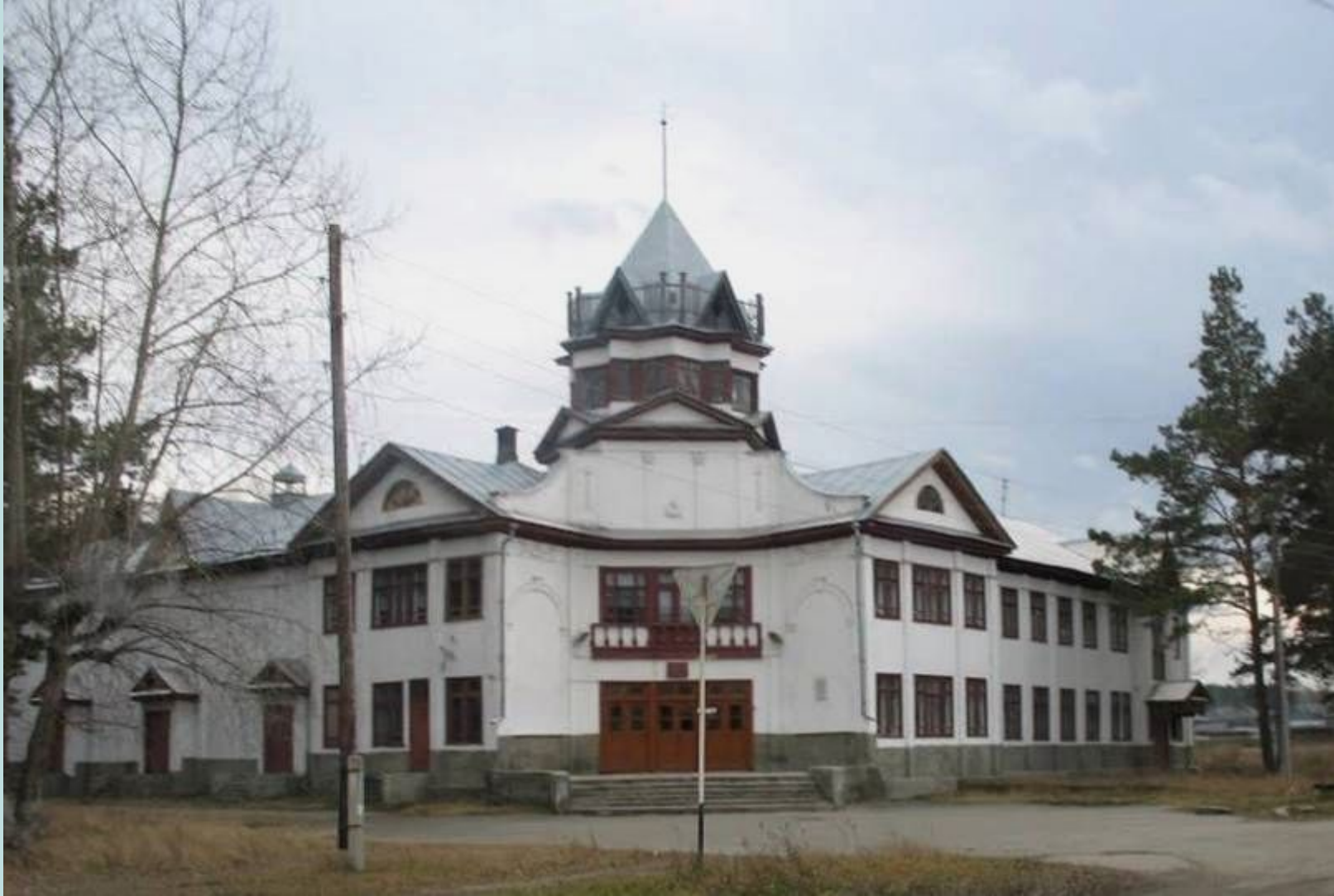
быв. Тавдинский Дом пионеров им. Павлика Морозова (клуб имени Ф.Э. Дзержинского)