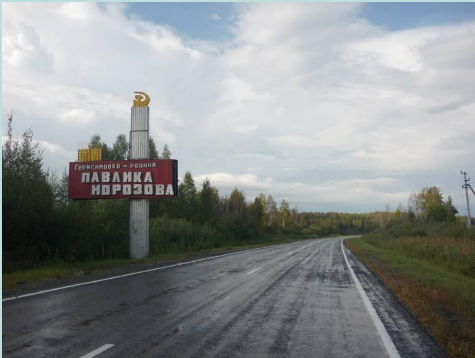
дорога в Герасимовку