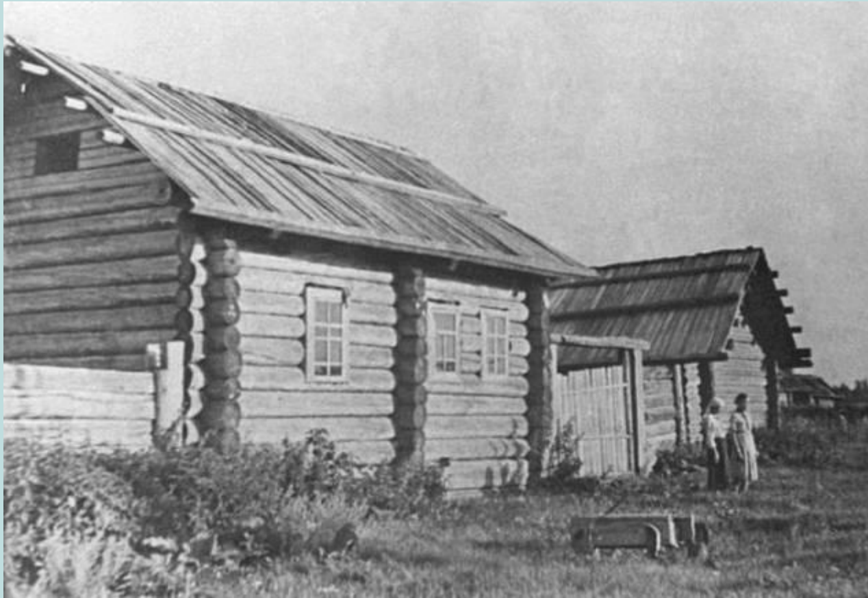
Герасимовка. Дом Морозовых, фото 50-х годов.