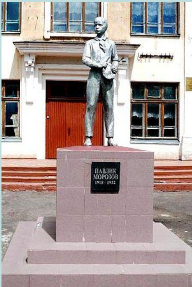
Памятник Павлику Морозову в городе Острове