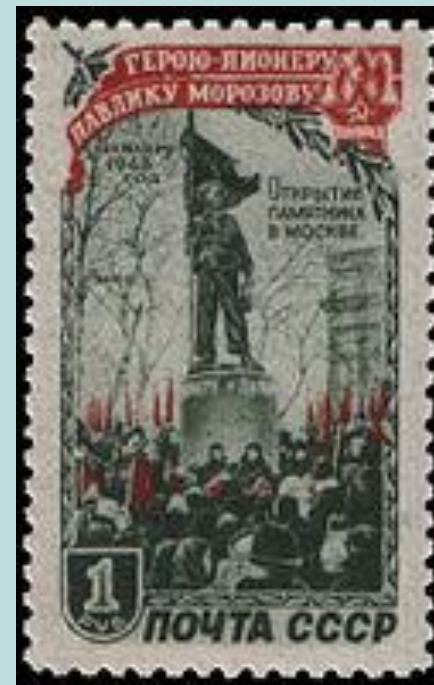
почтовая марка, 1950 г.