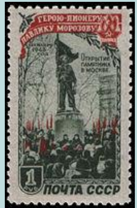
почтовая марка, 1950 г.