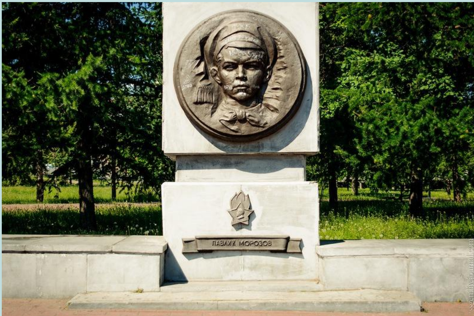
Челябинский мемориал в честь пионеров-героев на Алом поле