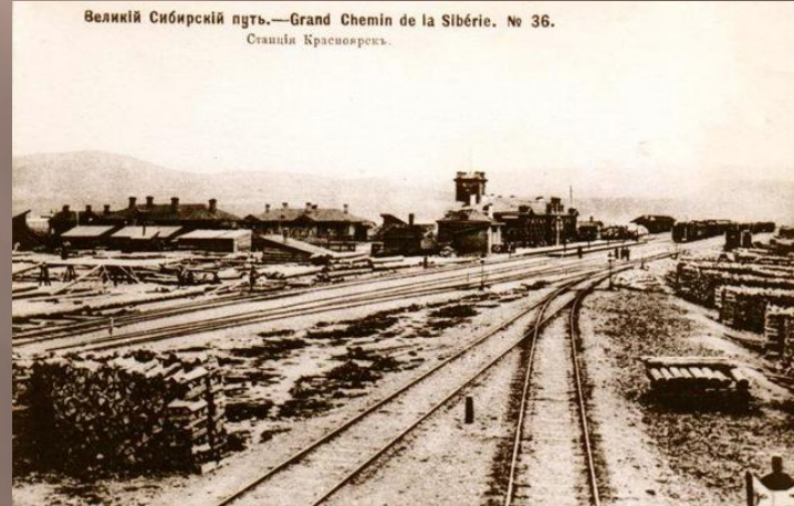
Великий Сибирский путь.—Grand Chemin de la Sibérie. No 36. Станция Красноярск.