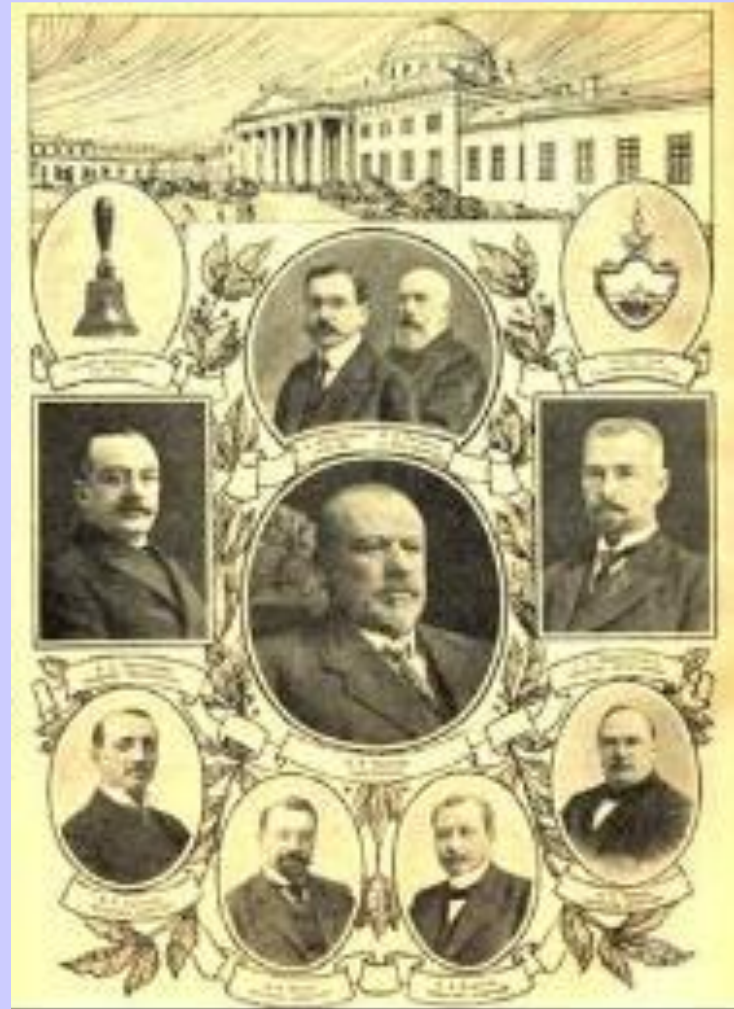
Президиум IV Думы.

В 1912 г. начала свою работу IV Государственная Дума. В ней сохранился октябристский маятник и председателем Думы стал М.В.Родзянко. Хотя большинство было за черносотенцами Дума была настроена оппозиционно и по многим вопросам Родзянко конфликтовал с Николаем II.