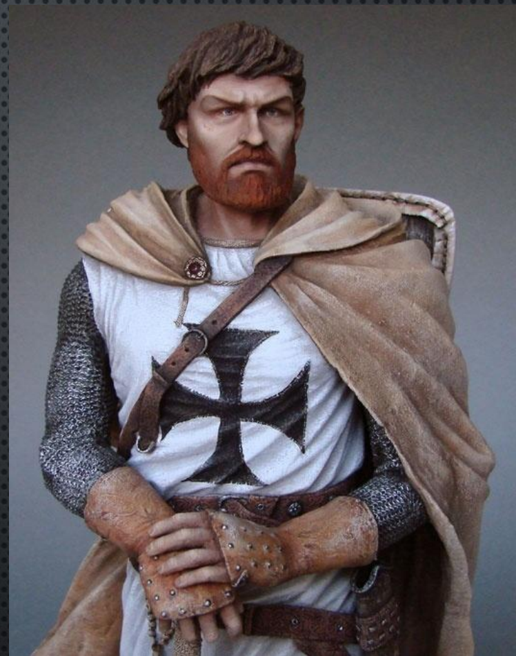
Фридрих I Барбаросса