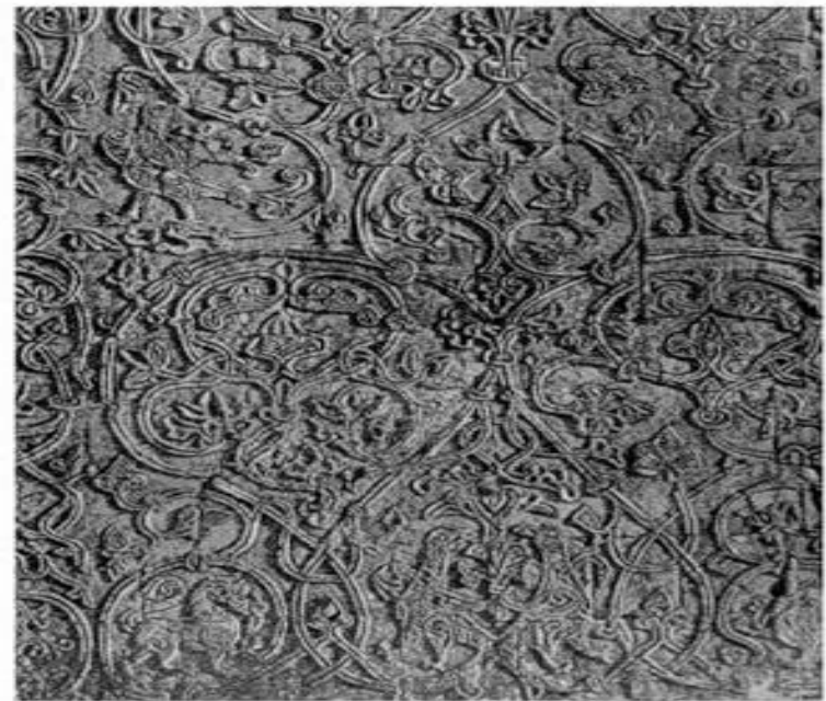
Рис. 103. ИЛЛЮСТРАЦИИ К ЛЕГЕНДЕ О ПТИЦЕ, ДОСТАВШЕЙ СО ДНА МИРОВОГО ОКЕАНА КОМОЧЕК ИЛА, ИЗ КОТОРОГО БЫЛА СОТВОРЕНА ЗЕМЛЯ а — волжско-болгарское кольцо с птицей; б — колт из Киева с птицей-гоголем; в — птицы на белокаменном резном узоре (Георгиевский собор в Юрьеве-Польском, 1236 г.)