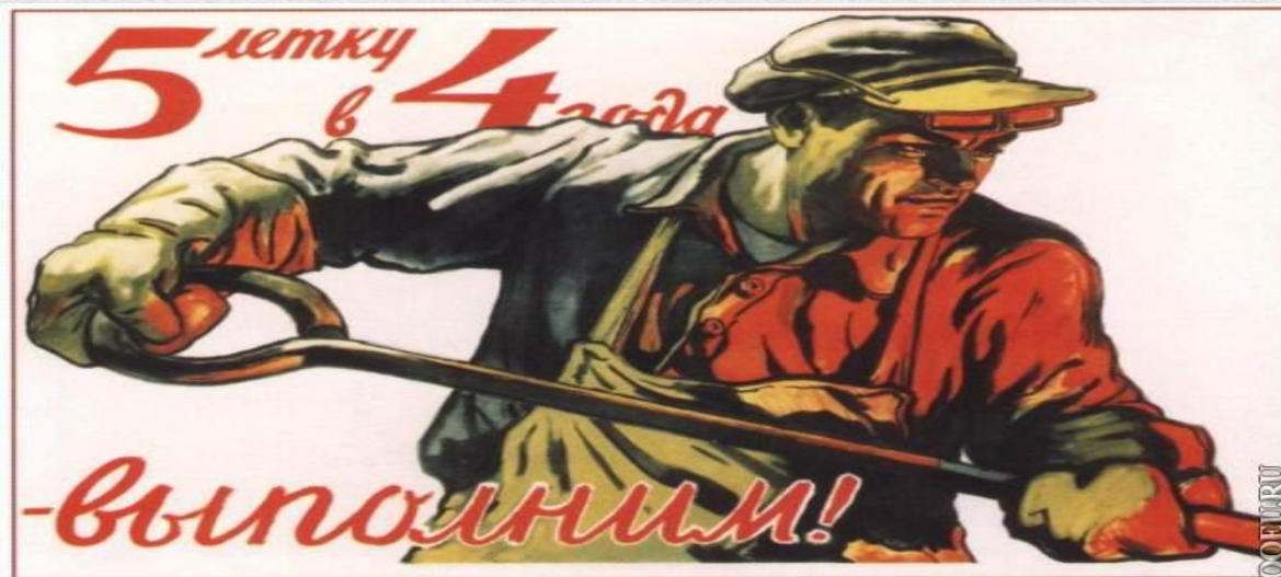
351. Иванов В. 5-летку в 4 года — выполним! 1948