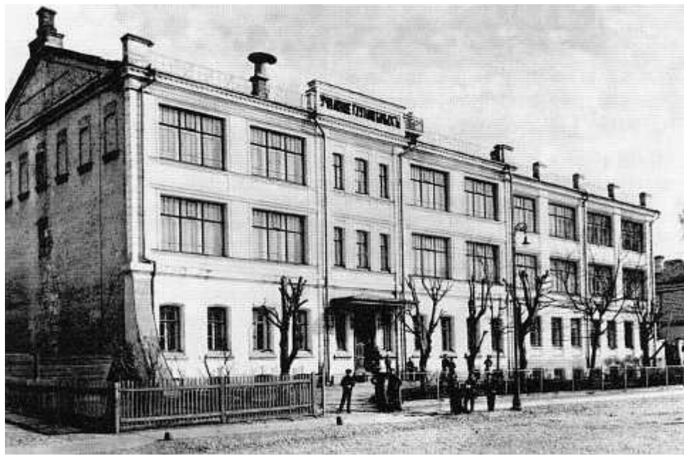
Арнольдо-Третьяковское училище для глухонемых

Обладая не самым крупным в Москве состоянием, Павел Михайлович пользовался в купеческой среде большим авторитетом и многократно выполнял общественные обязанности, занимал выборные должности.