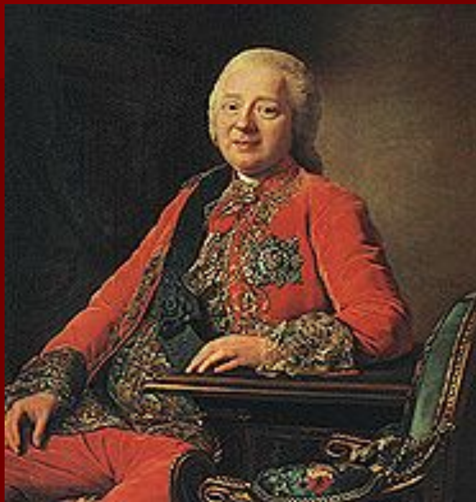
Н.И. Панин, сторонник Просвещения.