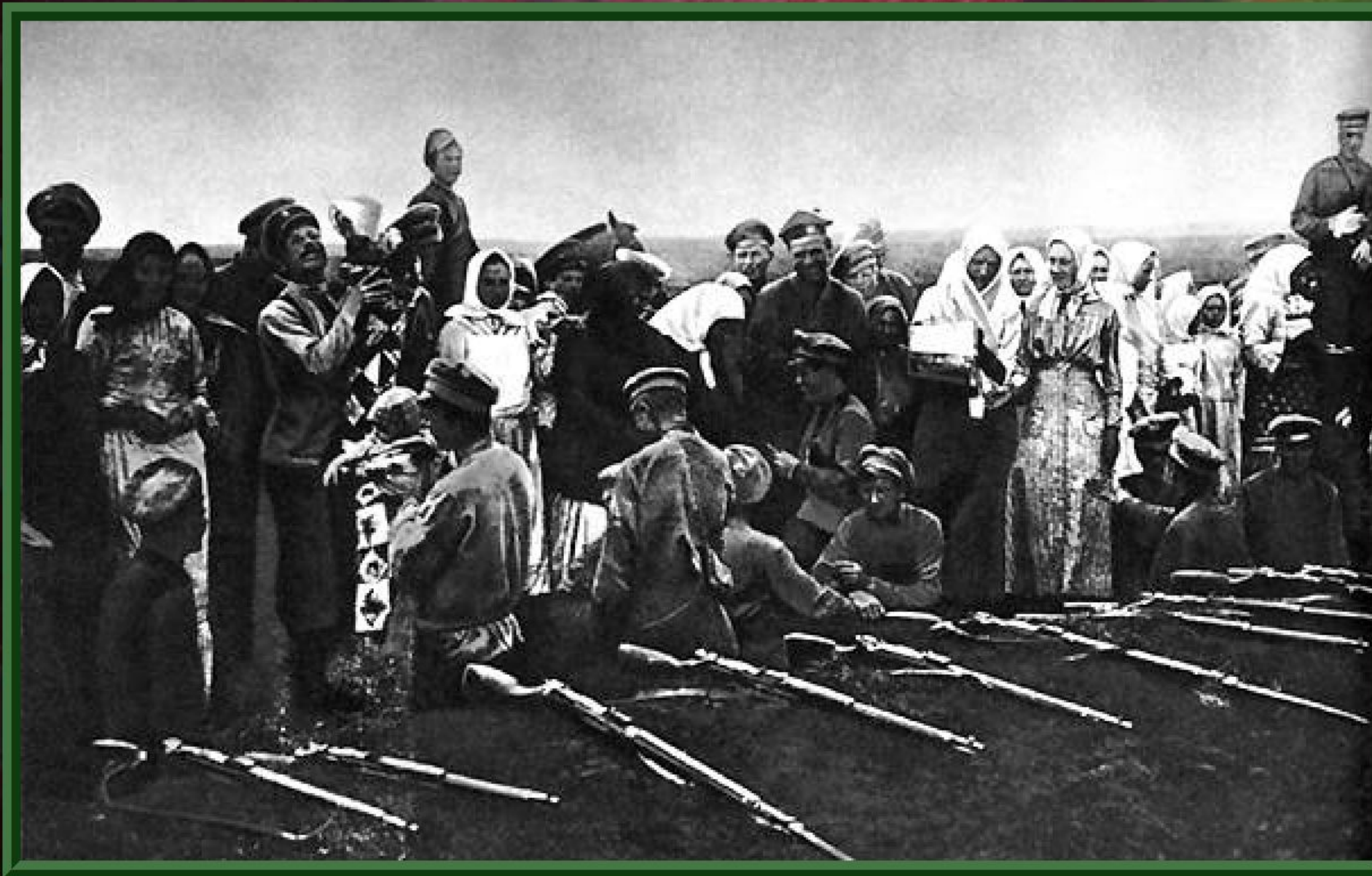
Крестьяне прифронтной полосы принесли пищу красноармейцам