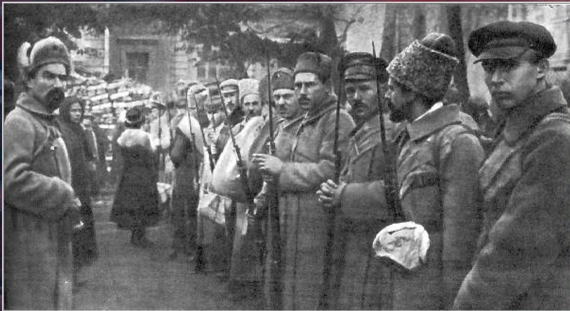
Мобилизация в ряды Красной Армии