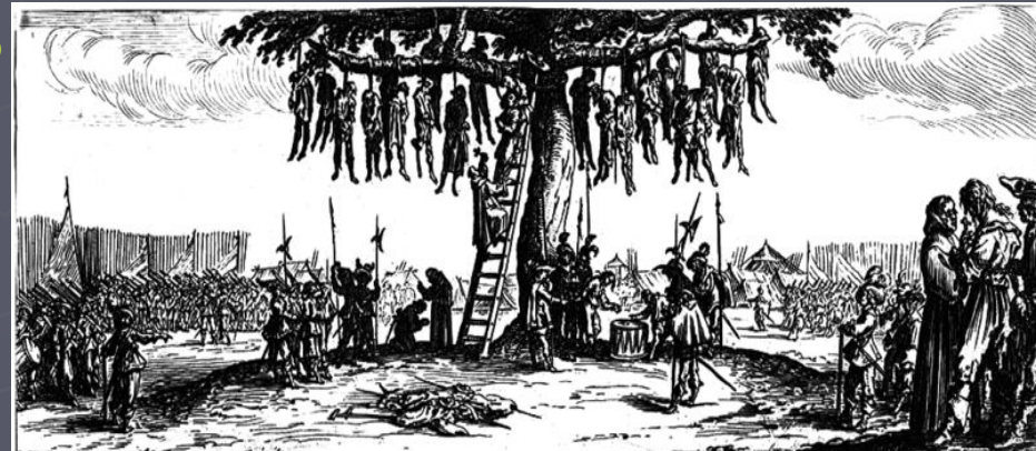
Après un Crime A la fin des douleurs infames et perdus Comme fruits malheureux à cet arbre pendus Monstrent bien que le crime horrible et noir'e engeance E'st les mêmes instrument de honte et de'sonpeance Et que c'est le Destin des hommes vicieux De poursuivre tost ou tard la justice des Cieux