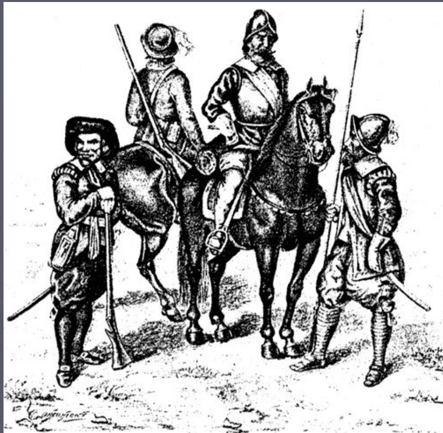
Шведские воины эпохи Густава-Адольфа (слева направо): мушкетер, драгун, кирасир, пикинер