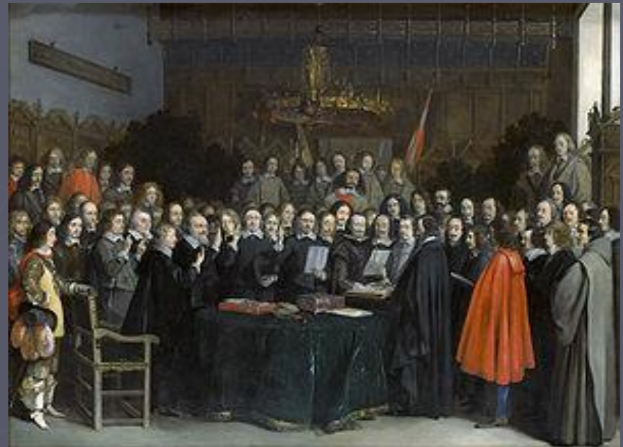
Подписание мира в Мюнстере