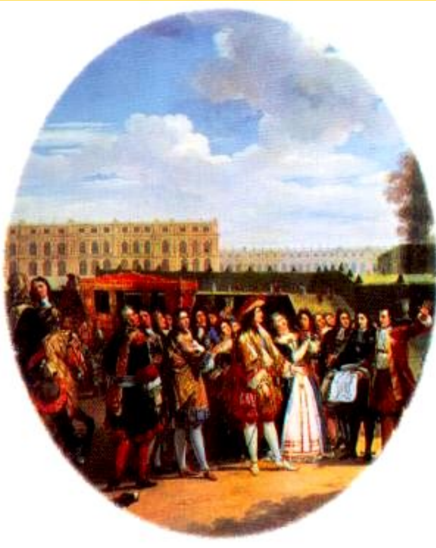
Людовик XIV осматривает Версаль

По окончании войны самыми могущественными государствами стали Швеция и Франция. Французскому королю подражали все европейские монархи. Версаль стал образцом дворцово-паркового зодчества.