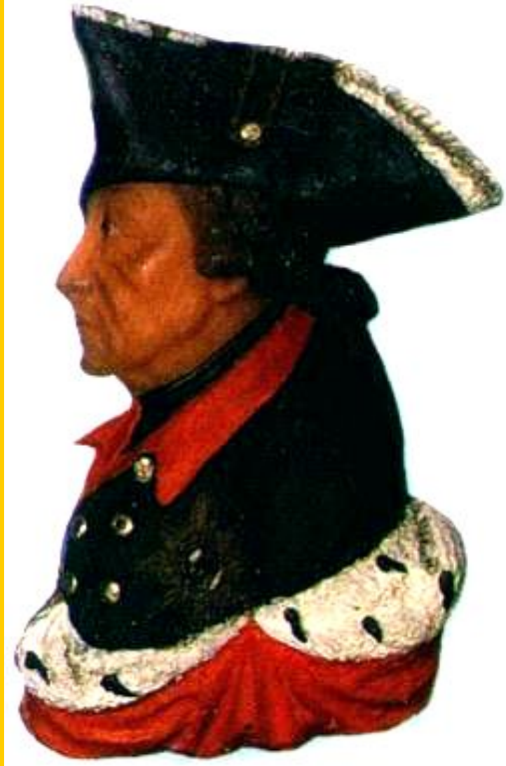
Фридрих II- Король Пруссии.

Международные отношения в 18в. были очень запутанны и противоречивы. Пруссия, возглавляемая Фридрихом II Великим начала захватнические войны. В ходе борьбы за австрийское наследство Фридрих захватил Силезию и стремился подчинить Саксонию, Чехию, часть Польши. Он полагал что ослабшая Франция не станет мешать.