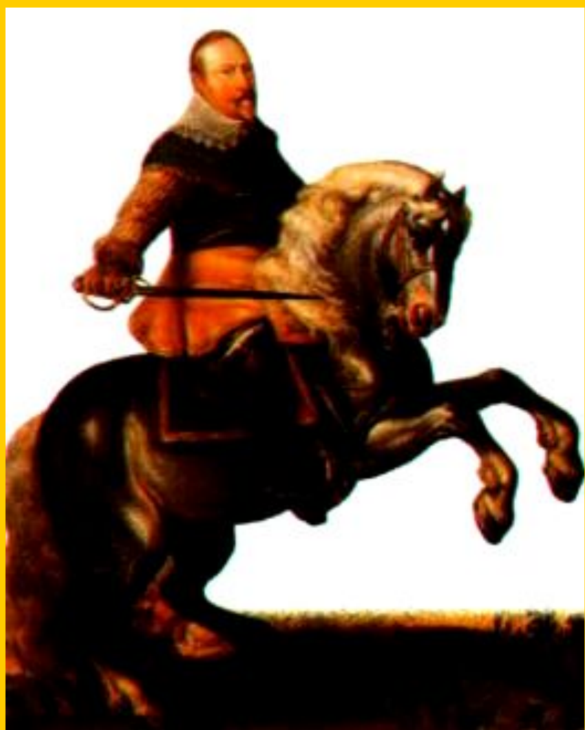
Шведский король Густав II Адольф

Вскоре в Германию вторглись шведы и в ноябре 1632 г. у Лютцена Густав II Адольф разбил католиков, но сам погиб.