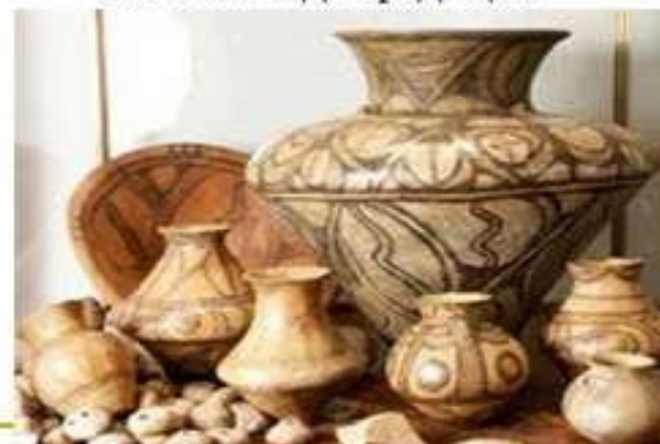
Кухонний посуд трипільців