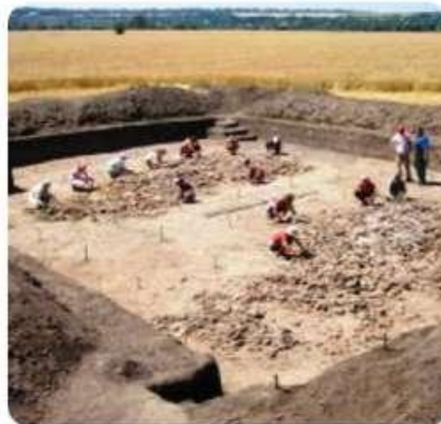
Розкопки під Городищем