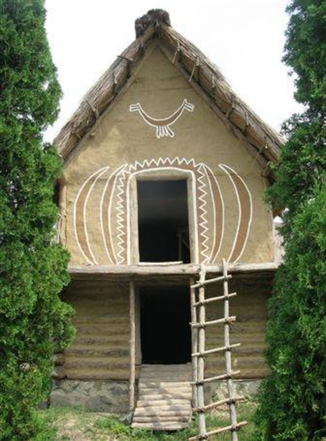
Музей Трипільського житла, с. Легедзине