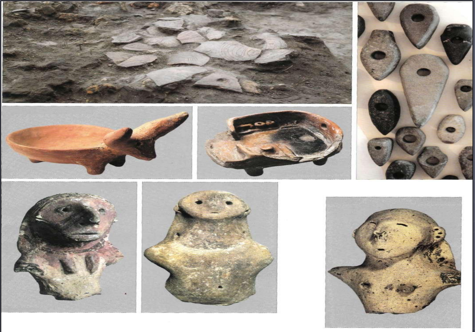
Залишки кераміки з розкопок. Зооморфна чаша. Модель житла трипільців. Кам'яні знаряддя, жіночі статуетки