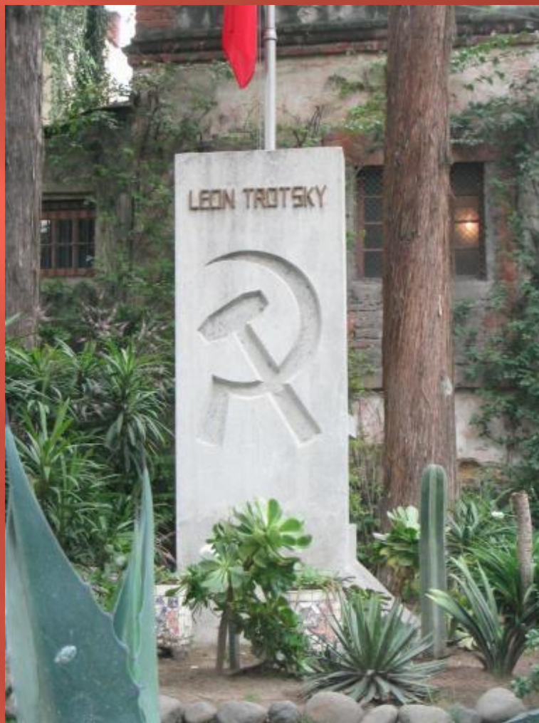
Могила Троцкого в Койоакане, Мексика