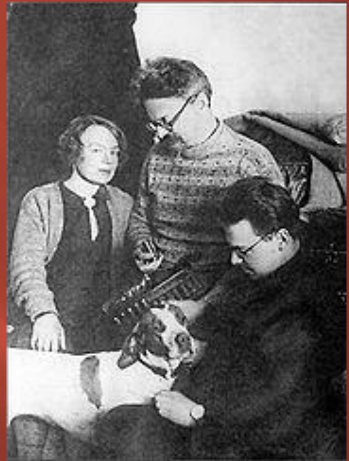
Троцкий в ссылке в Иркутской губернии. 1900

В 1907 году был осуждён на вечное поселение в Сибирь с лишением всех гражданских прав. По пути в Салехард бежал.