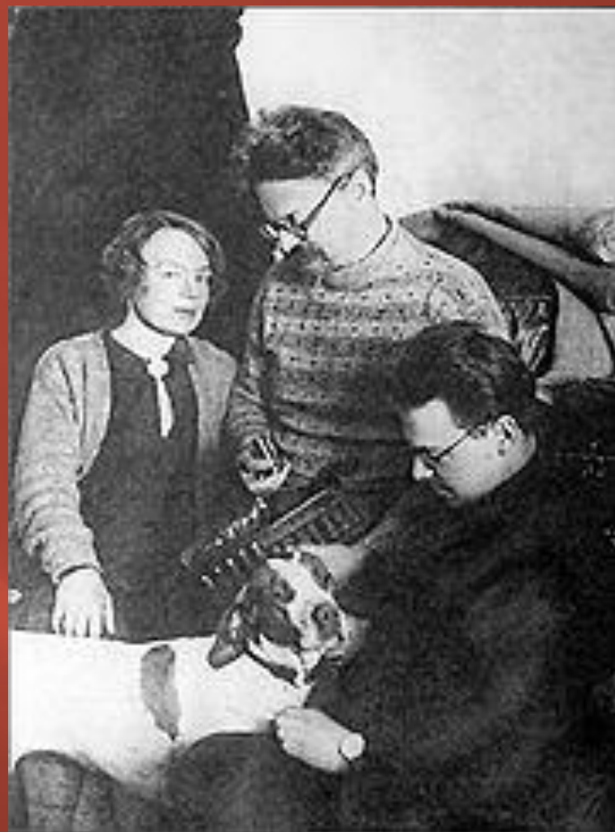
Троцкий в ссылке в Иркутской губернии. 1900

В 1907 году был осуждён на вечное поселение в Сибирь с лишением всех гражданских прав. По пути в Салехард бежал.