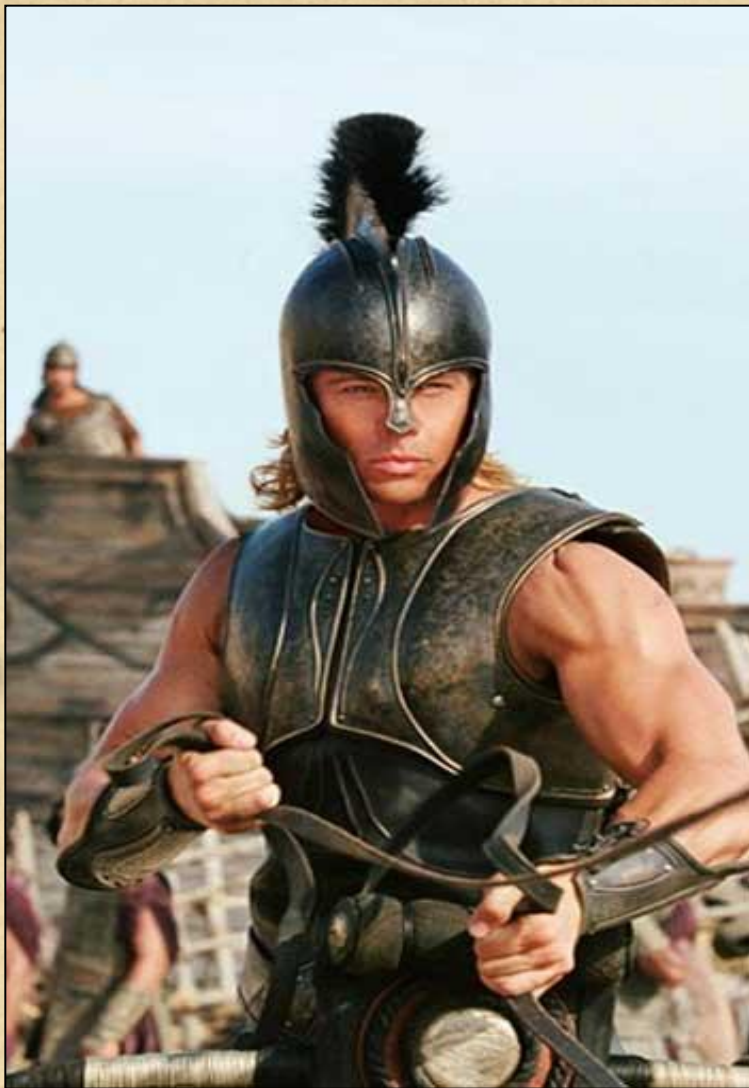
Патрокл в доспехах Ахиллеса