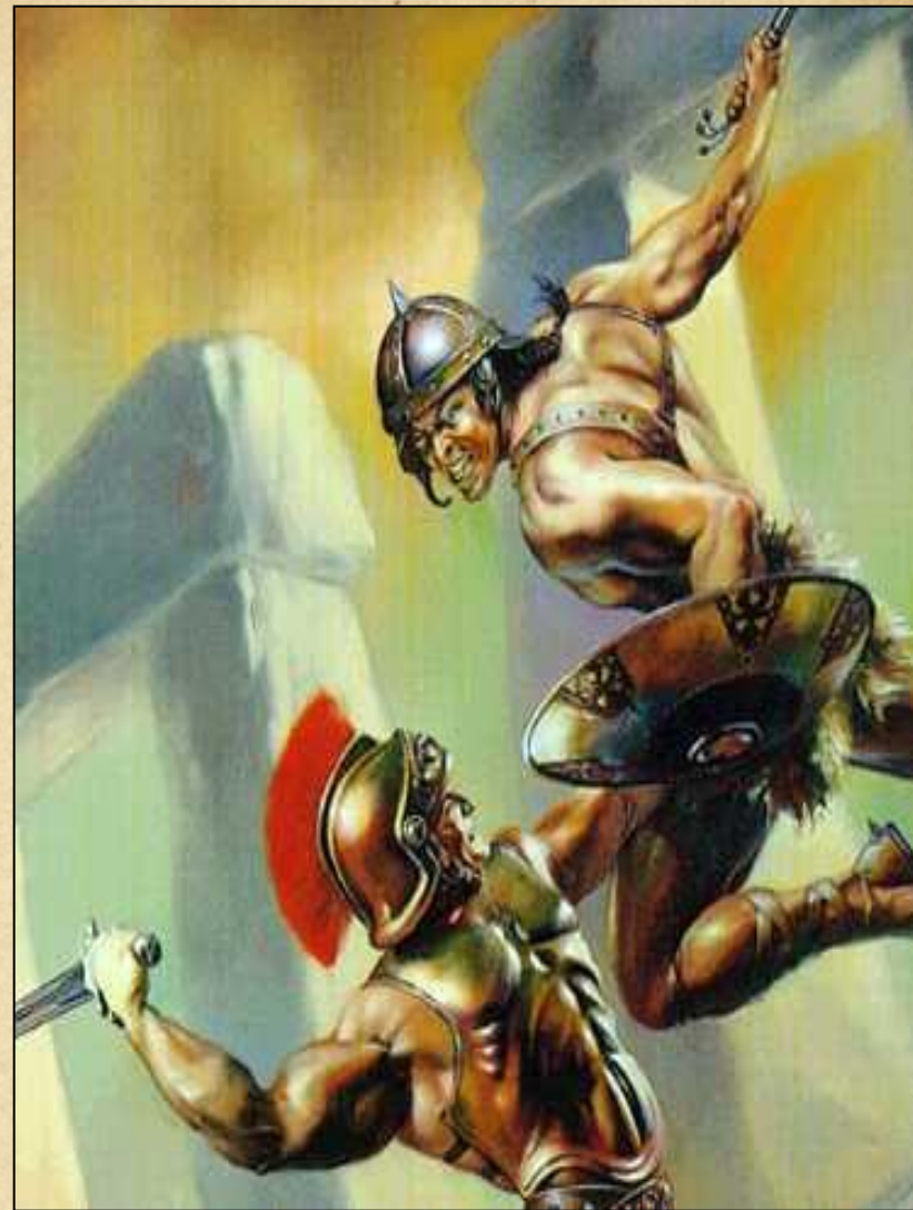
Поединок Патрокла и Гектора