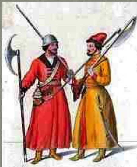
Стрельцы в России составили первое постоянное пешее войско.