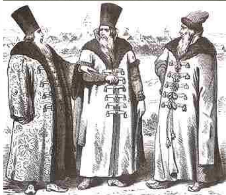
Русские бояре XVI-XVII вв.