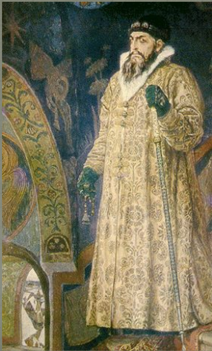
В. М. Васнецов Царь Иван Грозный, 1897