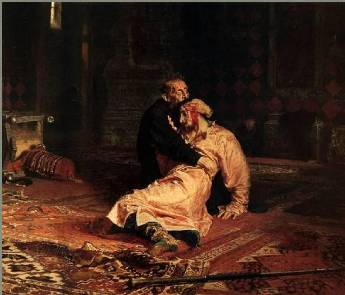
Иван Грозный и сын его Иван 16 ноября 1581 года (И.Репин, 1885 г.)