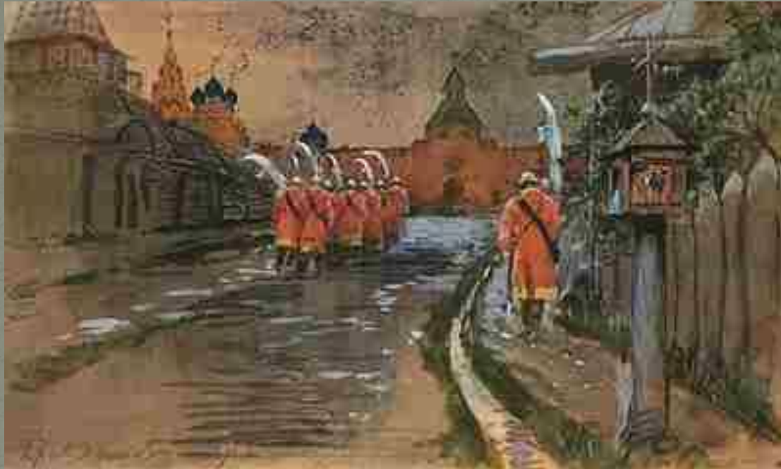
Рябушкин А. П. Стрелецкий дозор у Ильинских ворот в старой Москве

Стрельцы составили постоянный московский гарнизон. Формирование стрелецкого войска началось в 1540-е годы при Иване IV Грозном.