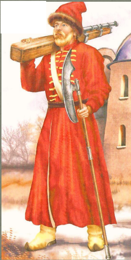
Стрелец — служилый человек