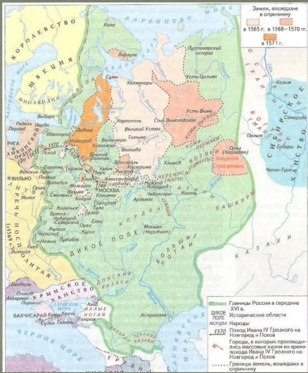
Россия при Иване IV