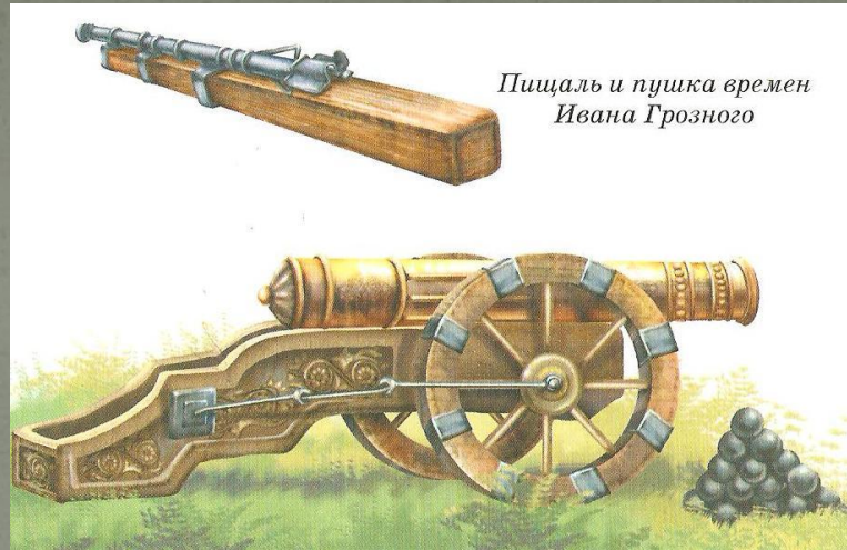
Пищаль и пушка времен Ивана Грозного