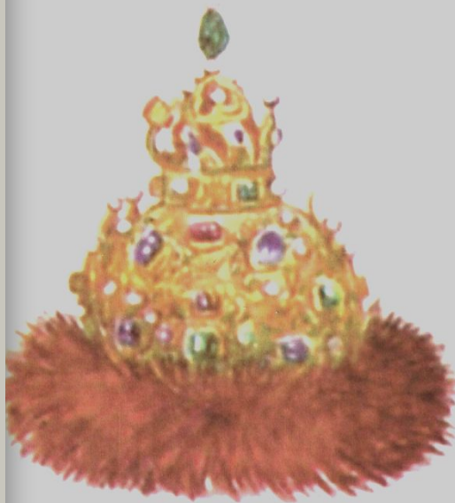
Венец (шапка Мономаха)