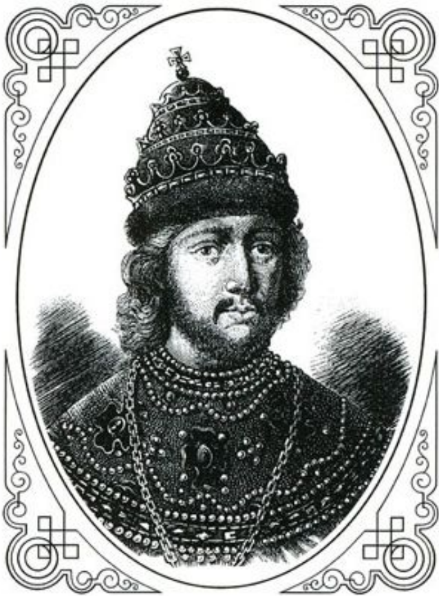
Фёдор Алексеевич (1661-1682)

Власть при нем была сосредоточена в руках его родственников по матери бояр Милославских.