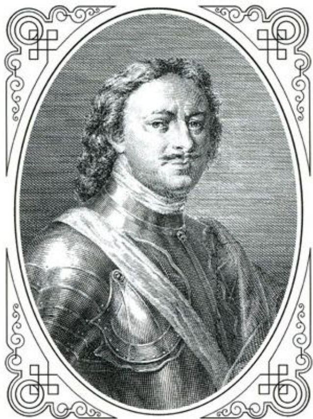
Пётр I Алексеевич (1672-1725)