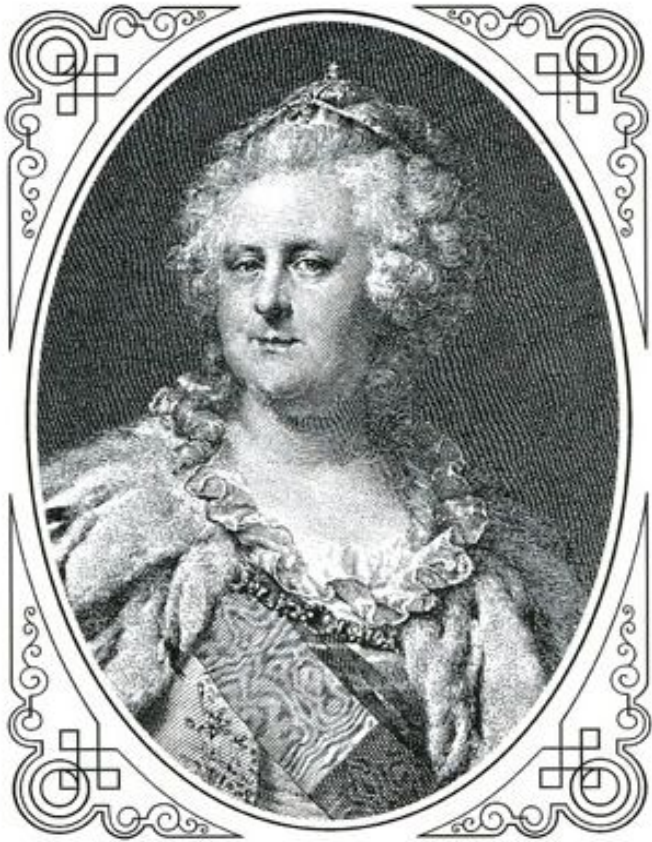
Екатерина II Алексеевна (1729-1796)

Екатерина II вступила на престол в результате дворцового переворота, свергнув своего мужа императора Петра III Федоровича. Екатерина от природы была одарена большим умом и сильным характером.