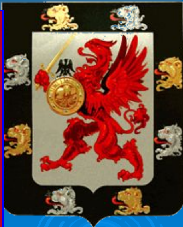
Фамильный герб Романовых