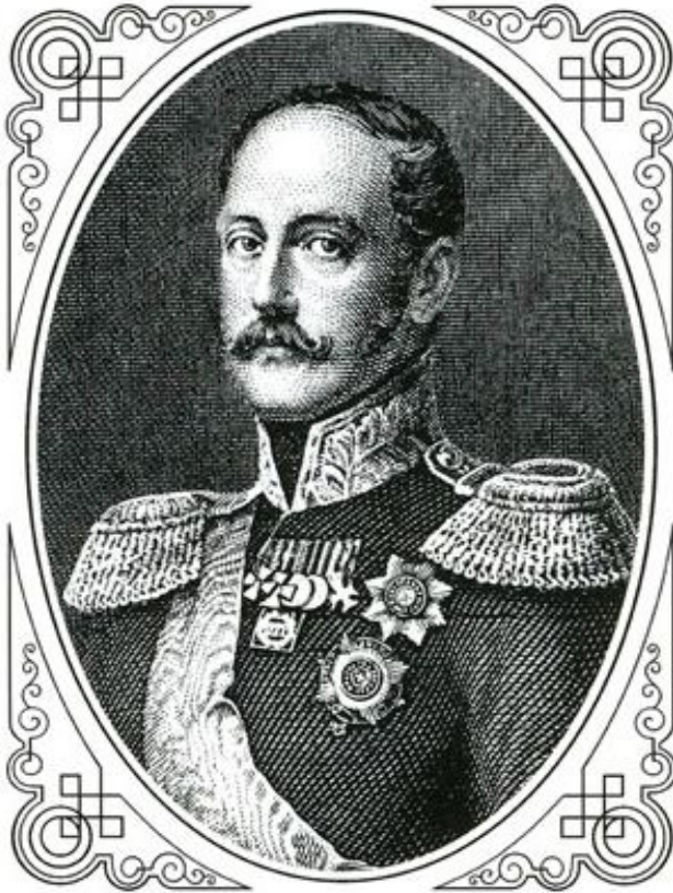
Николай I Павлович (1796-1855)

Царствование Николая I - период наивысшего расцвета абсолютной монархии, апогей самодержавия.