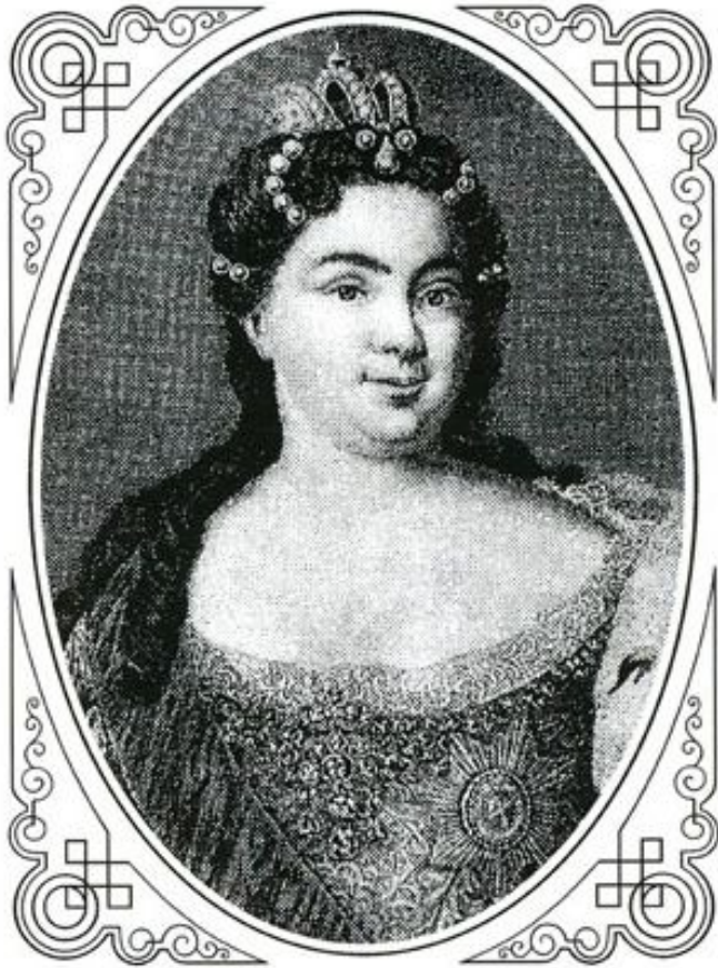
Екатерина I Алексеевна

В годы правления Екатерины I произошли такие события, как открытие Академии наук, организация морской экспедиции В. Беринга, учреждение ордена Св. Александра Невского.