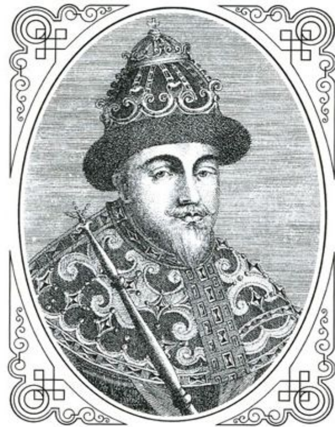
Алексей Михайлович (1629-1676)

В это время были жестоко подавлены народные восстания в Москве - Соляной бунт (1648) и Медный бунт (1662), крестьянская война под предводительством С.Т. Разина.