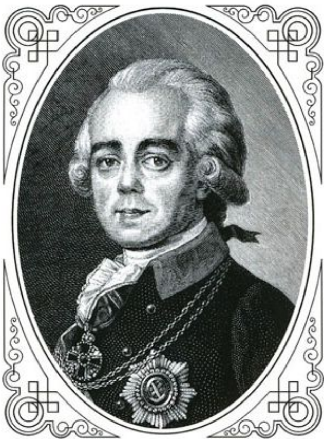
Павел I Петрович

Почти все указы Павла, предполагавшие искоренение беспорядков в делах, лишь нарушали прежнюю стройность системы, созданной при Екатерине II.