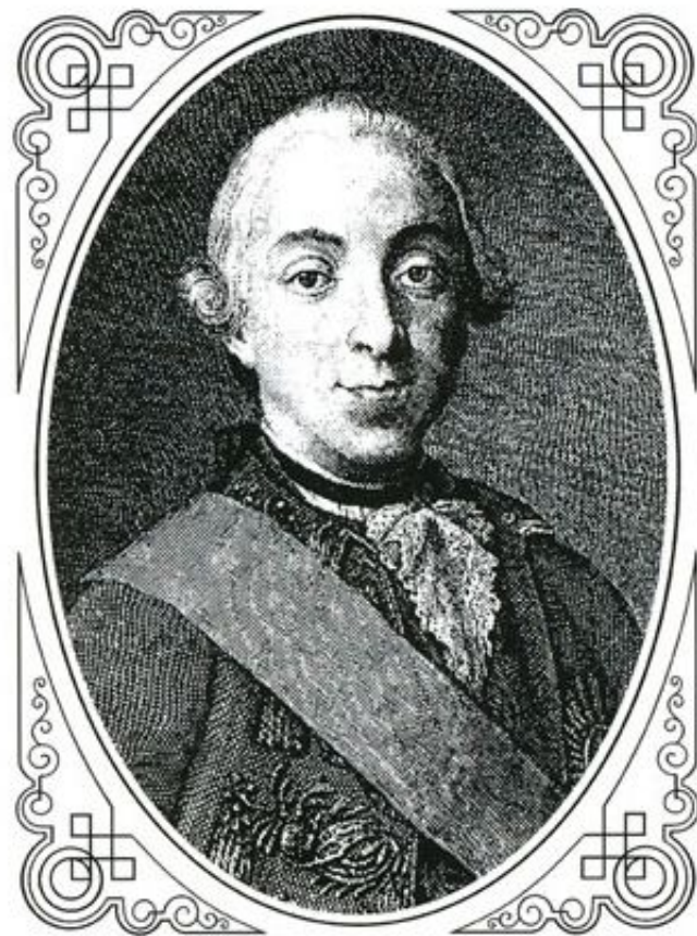
Пётр III Фёдорович

Петра I. Во время семимесячного царствования Петра III было издано несколько важных указов: об упразднении Тайной канцелярии, о позволении бежавшим из России раскольникам вернуться на родину.