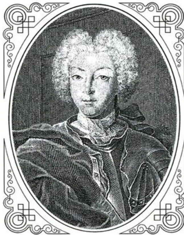
Пётр II Алексеевич

Петр Алексеевич, внук Петра I, вступил на престол по завещанию императрицы Екатерины I. Петр II объявил себя противником преобразований Петра I и ликвидировал созданные его дедом учреждения. Иностранцы писали, что "все в России в страшном беспорядке".