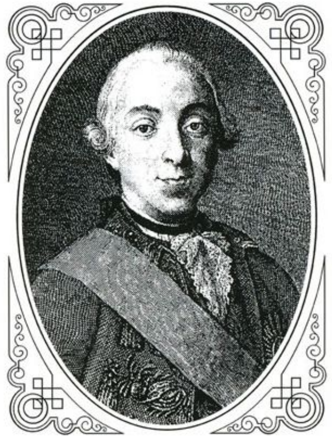
Пётр III Фёдорович

Петра I. Во время семимесячного царствования Петра III было издано несколько важных указов: об упразднении Тайной канцелярии, о позволении бежавшим из России раскольникам вернуться на родину.