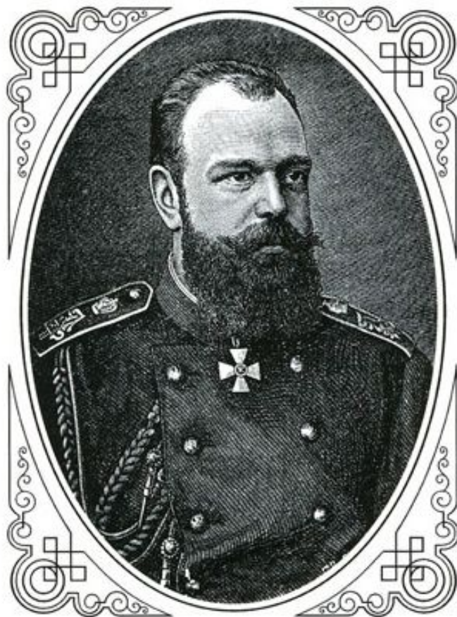
Александр III Александрович

императора Александра II, на престол вступил его сын Александр III. Твёрдая политика Александра во внешних и внутренних делах дала России целых 13 лет непрерывного мира и благоденствия.