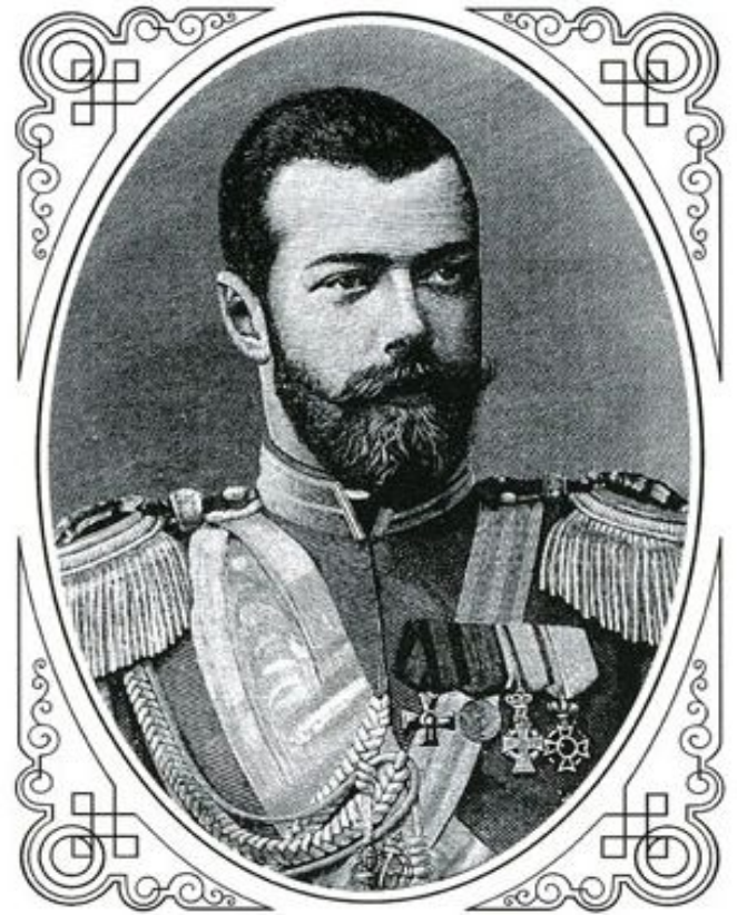
Николай II Александрович