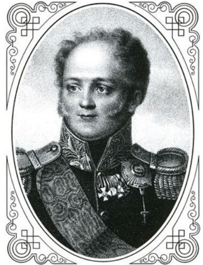
Александр I Павлович (1777-1825)

Александр I (старший сын императора Павла I и его второй жены императрицы Марии Федоровны. Император даровал свободу заключенным и сосланным его отцом, издал указ об уничтожении пыток, восстановил действие Жалованных грамот 1785 года. Восстанавливается право помещиков ссылать крепостных без суда в Сибирь.