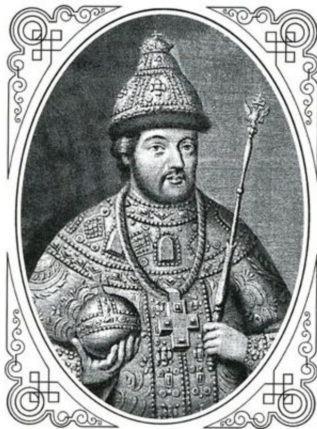
Иоанн V Алексеевич