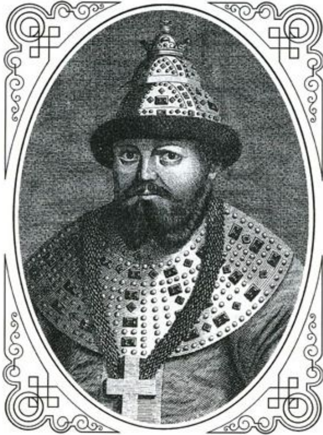
Михаил Фёдорович (1596-1645)

Воцарение Михаила Фёдоровича стало началом новой правящей династии Романовых.