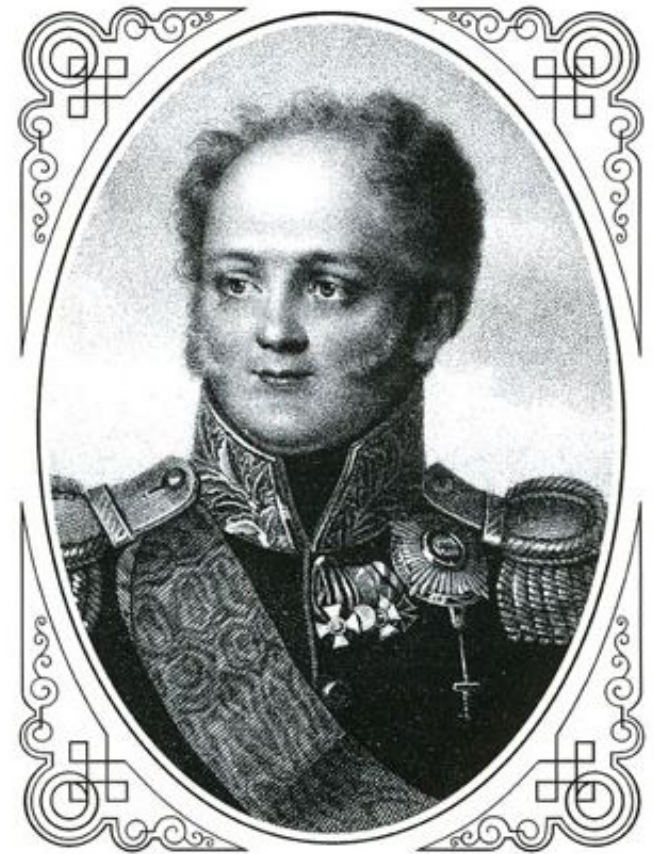
Александр I Павлович (1777-1825)

Александр I (старший сын императора Павла I и его второй жены императрицы Марии Федоровны. Император даровал свободу заключенным и сосланным его отцом, издал указ об уничтожении пыток, восстановил действие Жалованных грамот 1785 года. Восстанавливается право помещиков ссылать крепостных без суда в Сибирь.