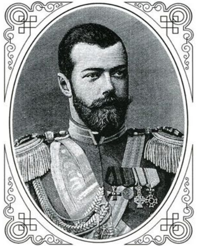
Николай II Александрович (1868-1918)

революционного движения. 17 октября 1905 года вышел Манифест, по которому признавались основы гражданской свободы: неприкосновенность личности, свобода слова, собраний и союзов. Была учреждена Государственная дума. По проекту П.А. Столыпина проводилась аграрная реформа. 2 марта 1917 года Николай II отрекся от престола.