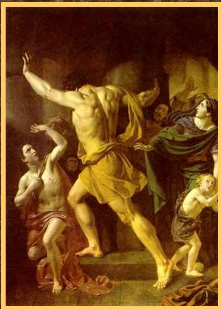
Самсон разрушает храм филистимлян.

Один из евреев Самсон обладал огромной силой. Он полюбил красавицу Далилу и та узнала, что его сила кроется в волосах. Спящего Самсона остригли и связали. Он был ослеплен и брошен в темницу. Филистимляне устроили пир и стали издеваться над Самсоном. Но его волосы уже отрасли. Самсон схватился за колонны и обрушил здание.