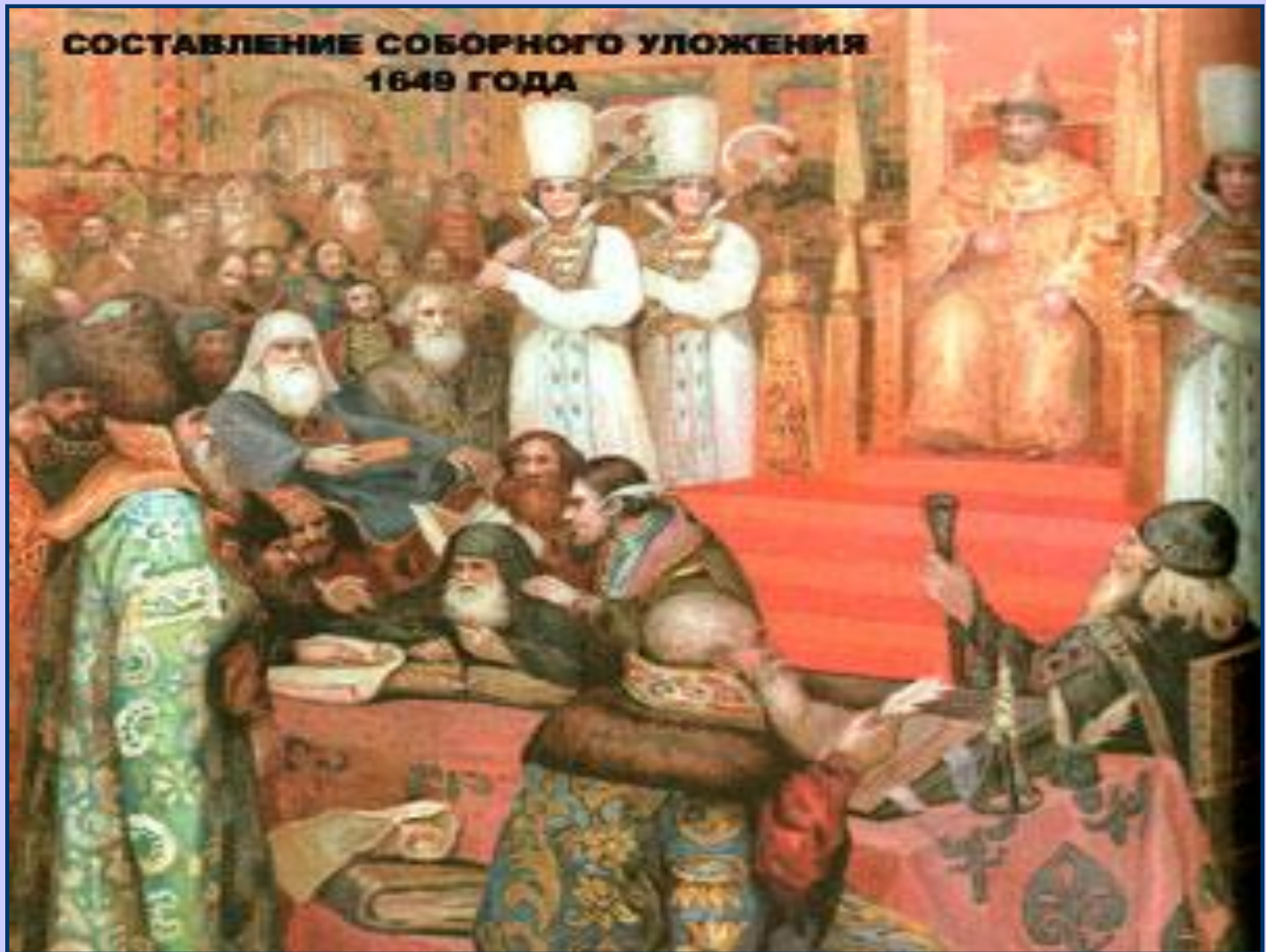
Земский собор 1648-1649 гг.