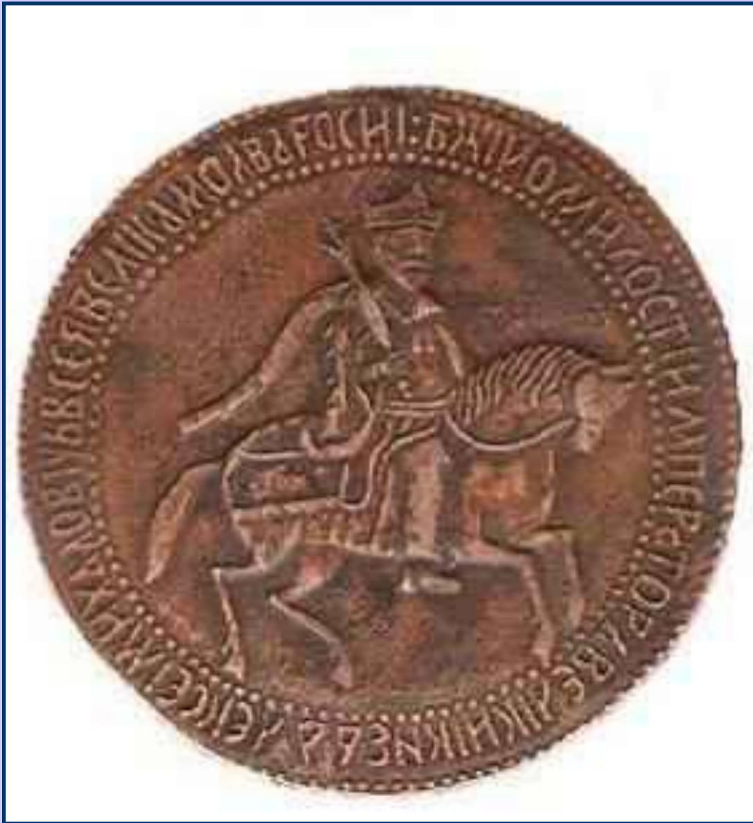
Медный рубль 1655-1663гг.