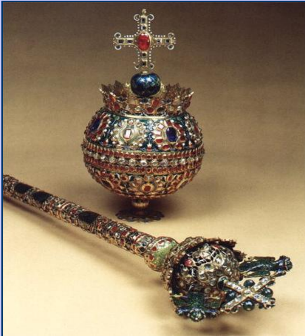
Скипетр и держава царя Алексея Михайловича Романова.