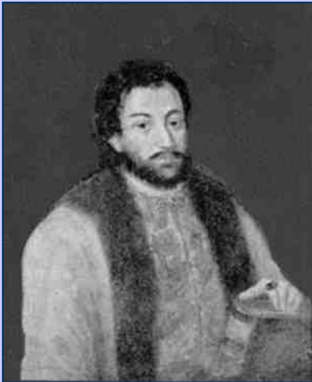
князь Н.И. Одоевский