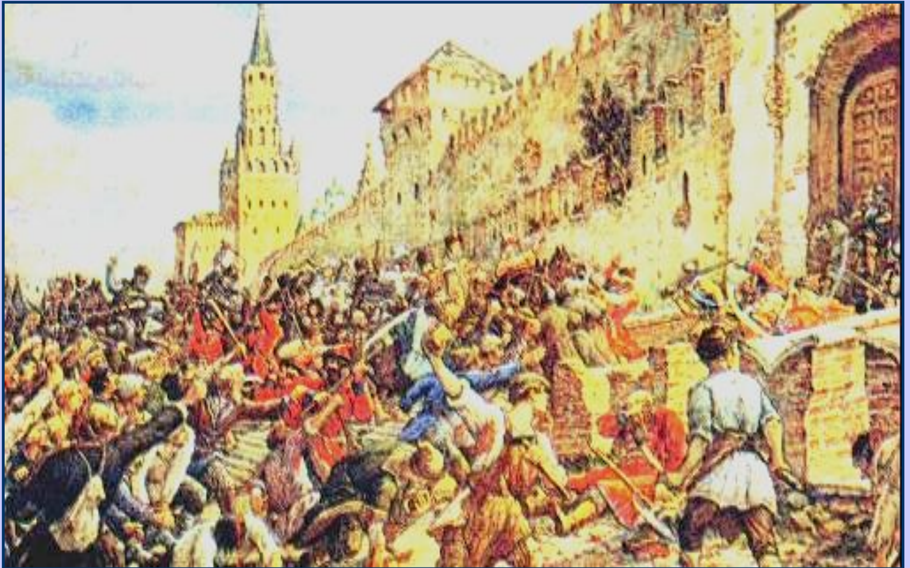
Соляной бунт 1648г.