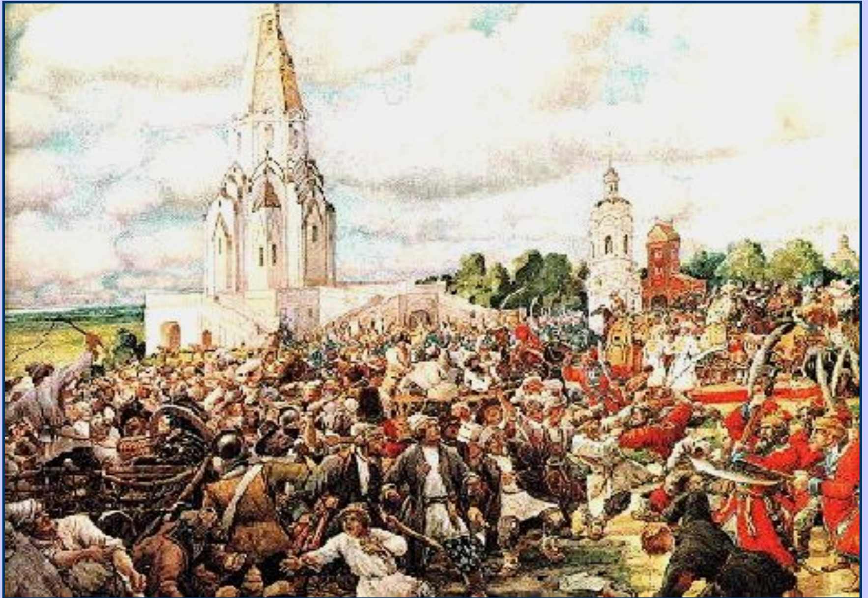
Медный бунт 1662 г.