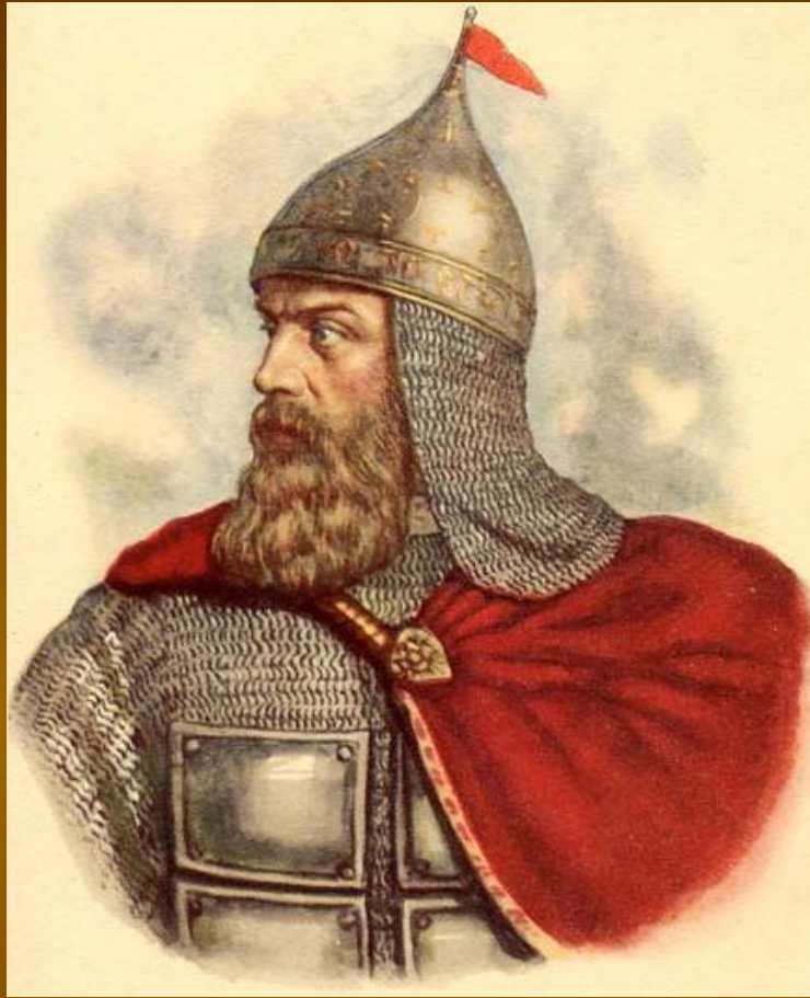
Портрет Дмитрия Донского в боевом облачении

Дмитрий Иванович Донской. (12 октября 1350, Москва — 19 мая 1389, там же), московский великий князь (с 1359), владимирский великий князь (с 1361), сын князя Ивана Красного, внук Ивана Калиты. В первые годы при малолетнем Дмитрие правительство возглавлял митрополит Алексий. При нем в 1367 году построен белокаменный кремль в Москве. В Куликовской битве (1380), завершившейся разгромом ордынцев, Дмитрий Иванович проявил выдающийся полководческий талант, за что был прозван Донским. В его княжение Москва утвердила свое руководящее положение в русских землях. Дмитрий Донской впервые передал великое княжение старшему сыну Василию без санкции Золотой Орды как «свою отчину». Канонизирован Русской православной церковью.