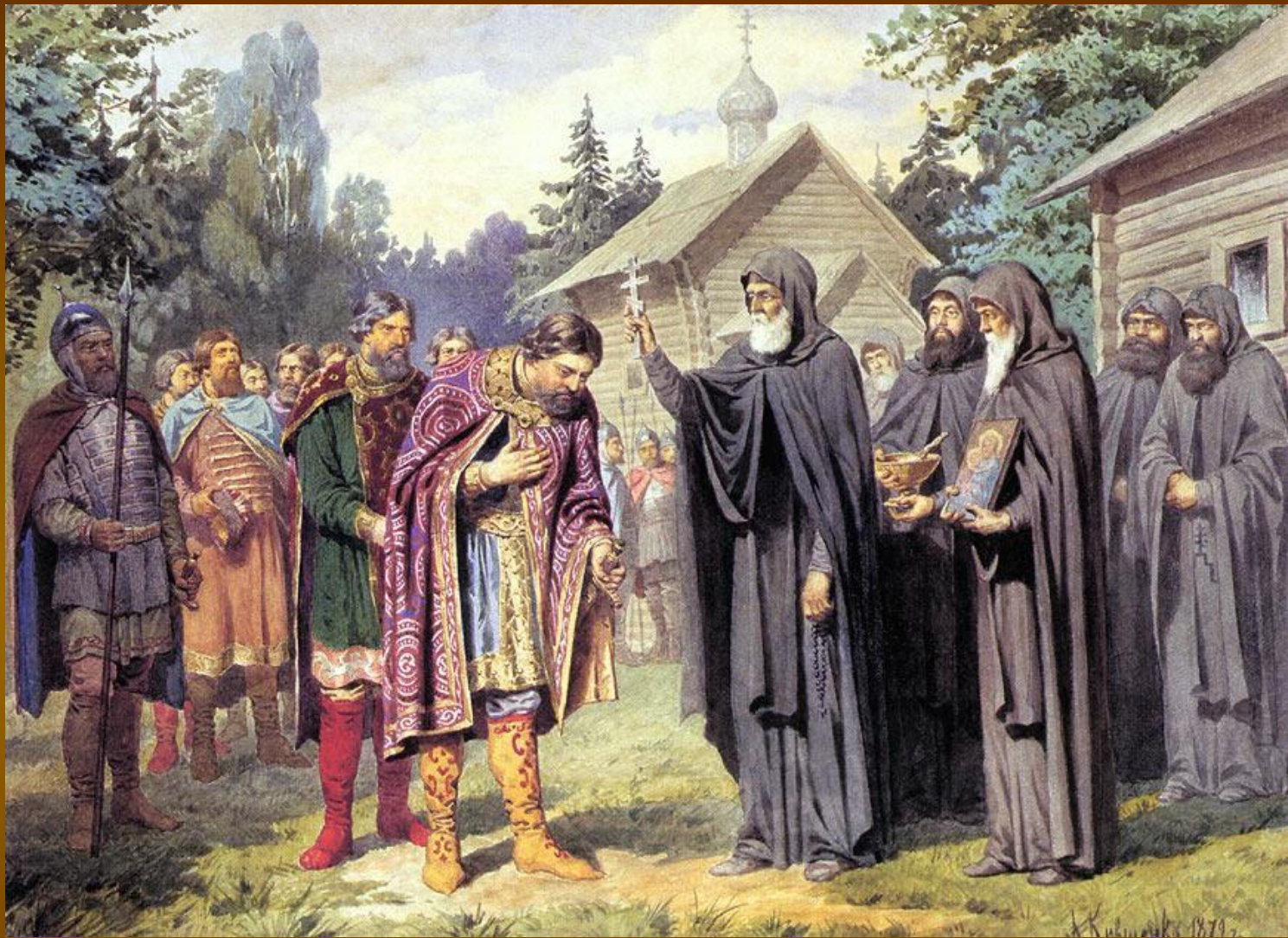
А. Д. Кившенко. «Посещение великим князем Дмитрием Сергия Радонежского перед выступлением в поход на татар. 1380 год». 1880.