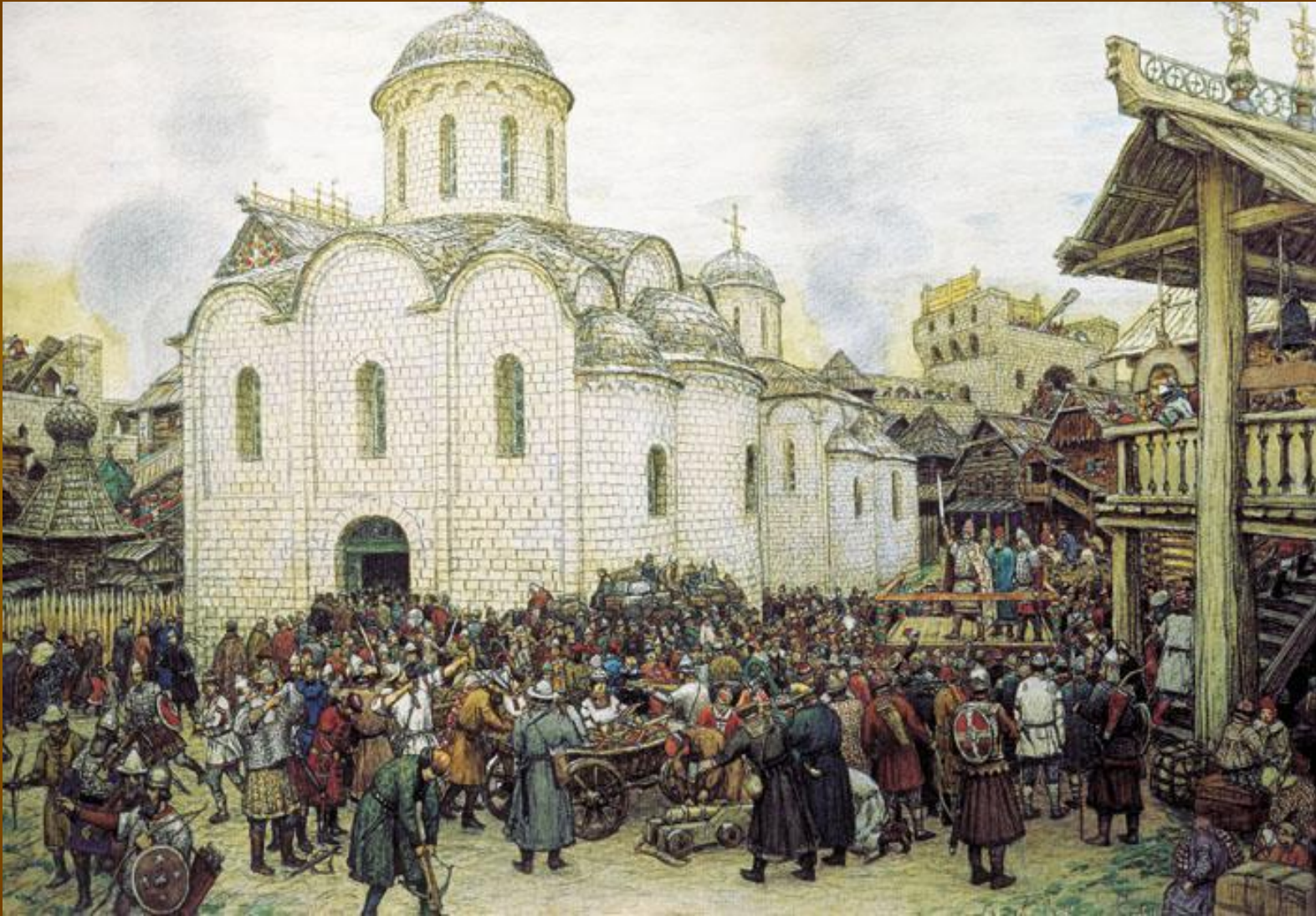
А. М. Васнецов «Оборона Москвы от хана Тохтамыша»