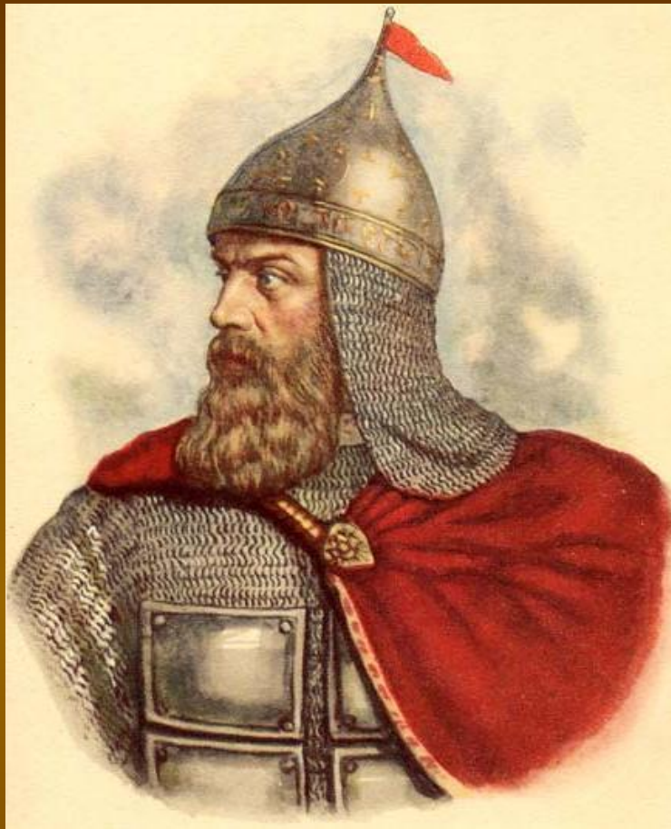
Портрет Дмитрия Донского в боевом облачении

Дмитрий Иванович Донской. (12 октября 1350, Москва — 19 мая 1389, там же), московский великий князь (с 1359), владимирский великий князь (с 1361), сын князя Ивана Красного, внук Ивана Калиты. В первые годы при малолетнем Дмитрие правительство возглавлял митрополит Алексий. При нем в 1367 году построен белокаменный кремль в Москве. В Куликовской битве (1380), завершившейся разгромом ордынцев, Дмитрий Иванович проявил выдающийся полководческий талант, за что был прозван Донским. В его княжение Москва утвердила свое руководящее положение в русских землях. Дмитрий Донской впервые передал великое княжение старшему сыну Василию без санкции Золотой Орды как «свою отчину». Канонизирован Русской православной церковью.