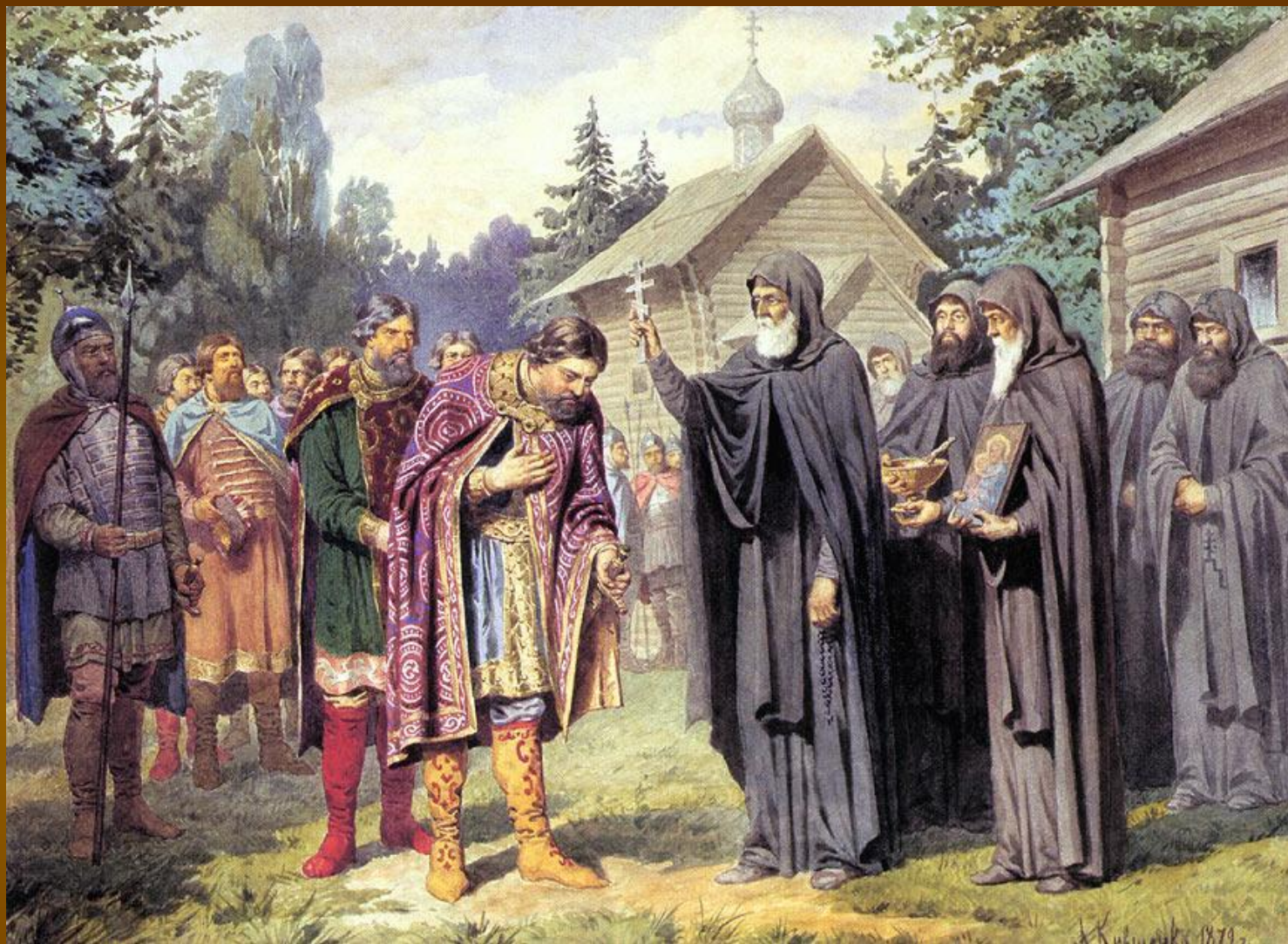
А. Д. Кившенко. «Посещение великим князем Дмитрием Сергия Радонежского перед выступлением в поход на татар. 1380 год». 1880.