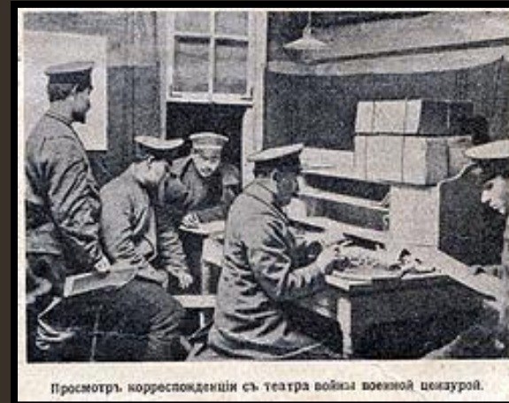
Просмотр корреспонденции с театра войны военной цензурой.