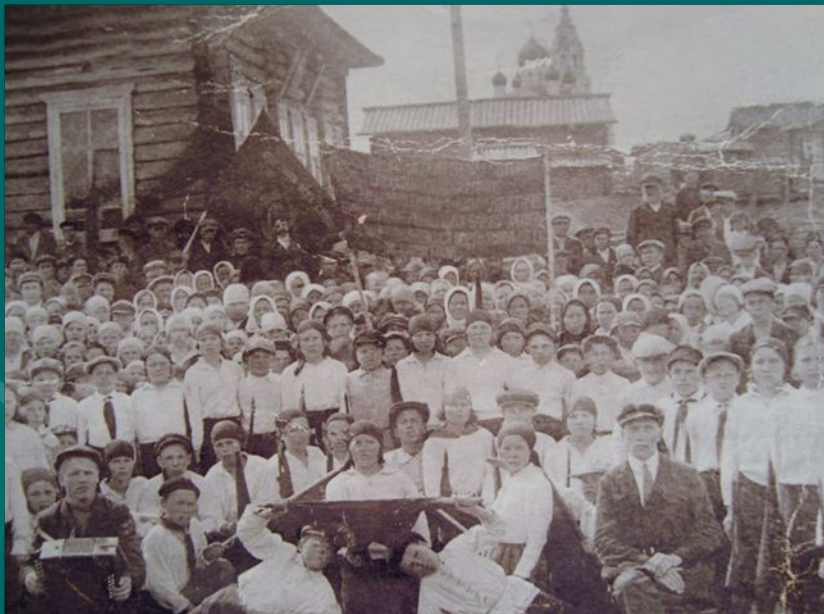
Фото 1967 года.