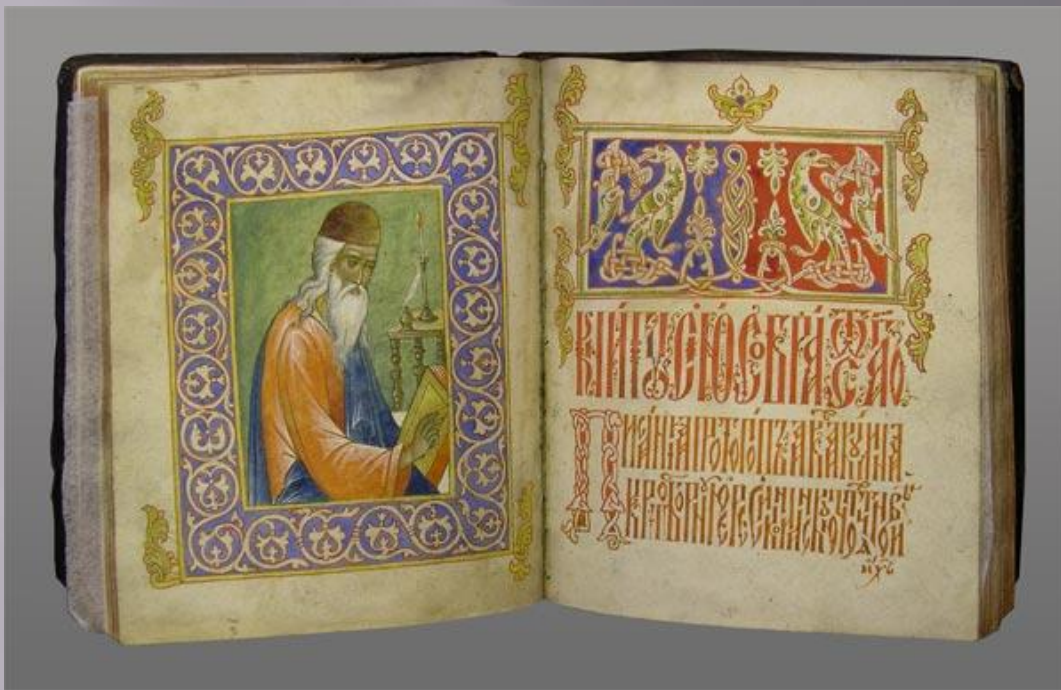
Житие протопопа Аввакума.