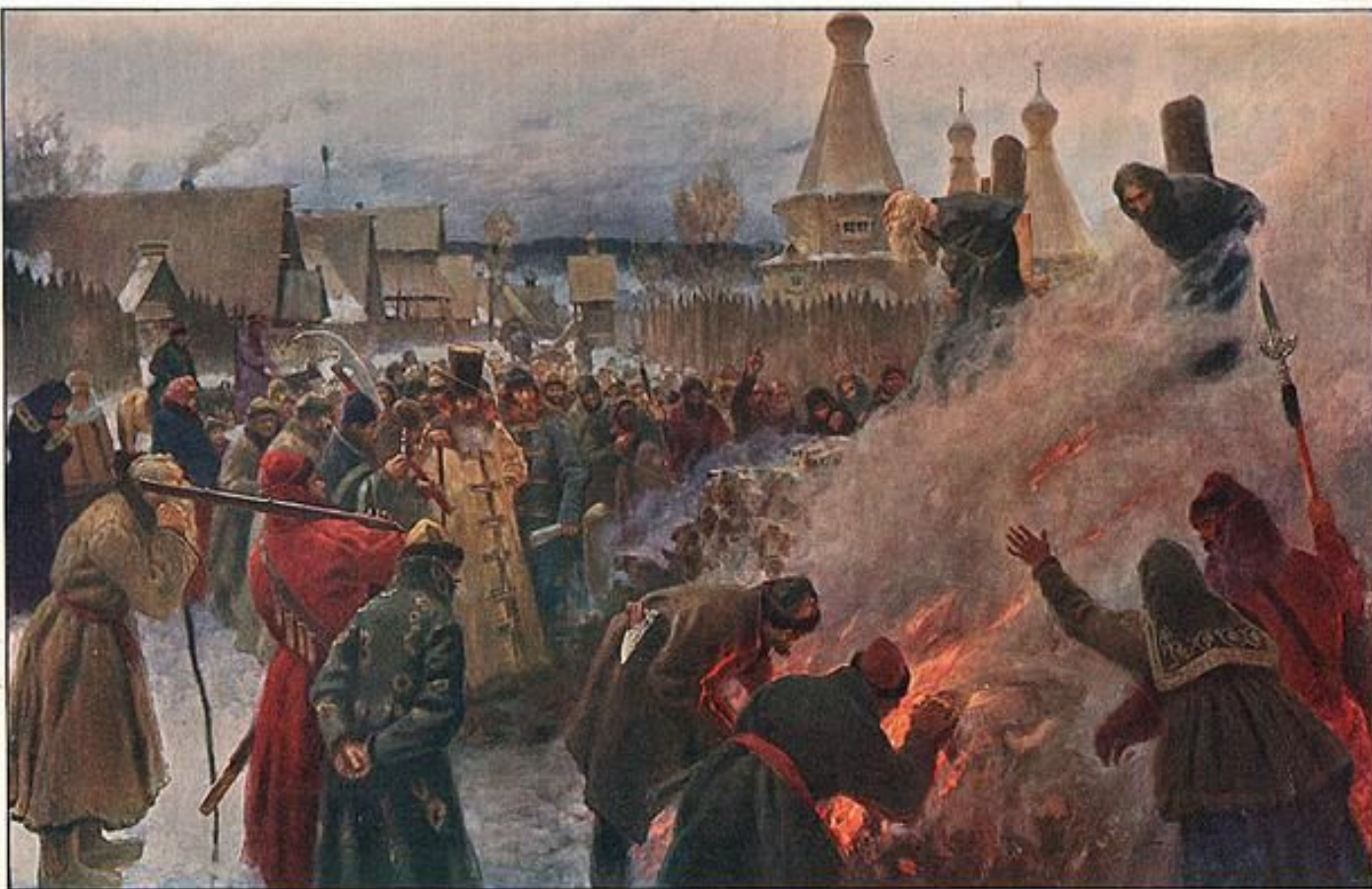
П. Мясоедов. Сожжение протопопа Аввакума. Музей Императорской Академии Художеств.