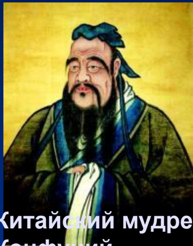
Китайский мудрец Конфуций