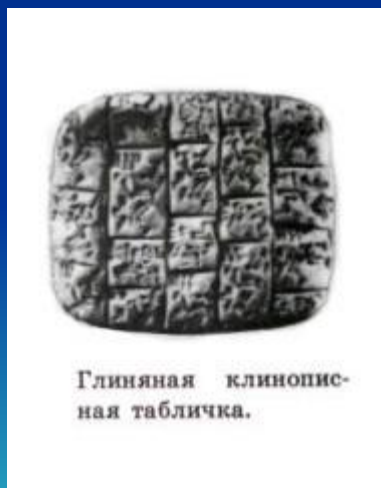
Глиняная клинописная табличка.