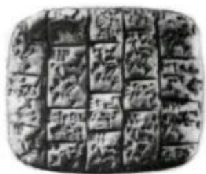
Глиняная клинописная табличка.