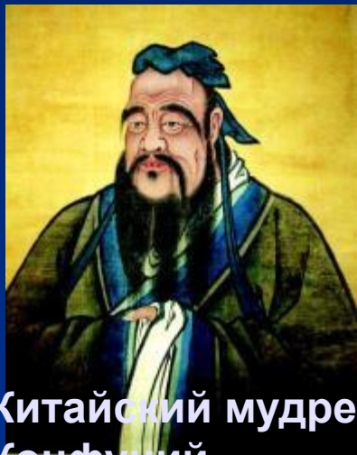
Китайский мудрец Конфуций