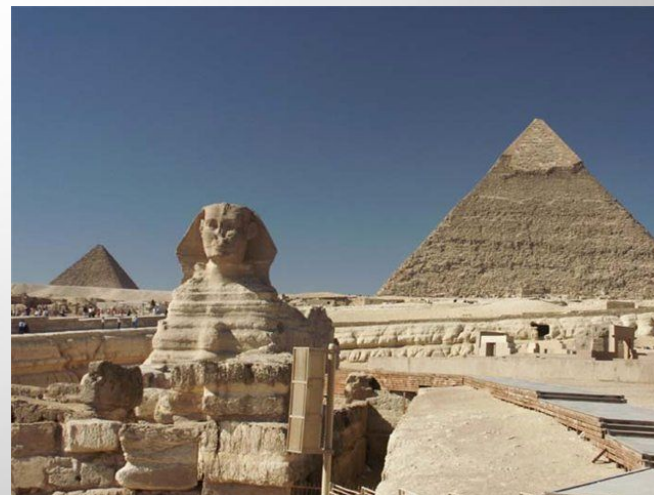
Египет - это древнейшая цивилизация