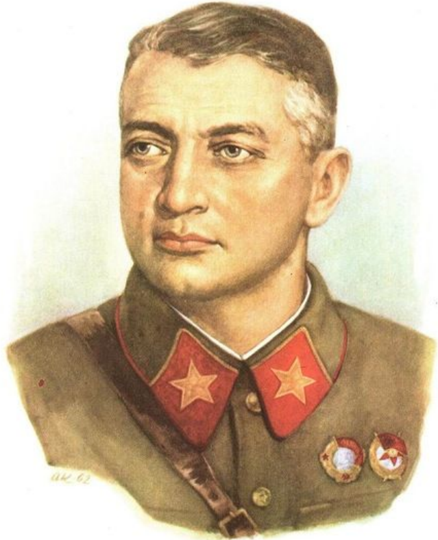
ТУХАЧЕВСКИЙ Михаил Николаевич (1893–1937)

Маршал Советского Союза, член КПСС с 1918 г. Видный советский военный деятель. Один из организаторов Красной Армии. В гражданской войне командовал армиями и фронтами. Активно участвовал в подавлении контрреволюционных мятежей в Кронштадте и Тамбовской губернии.