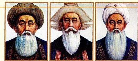
Әйтке би Қазыбек би Төле би