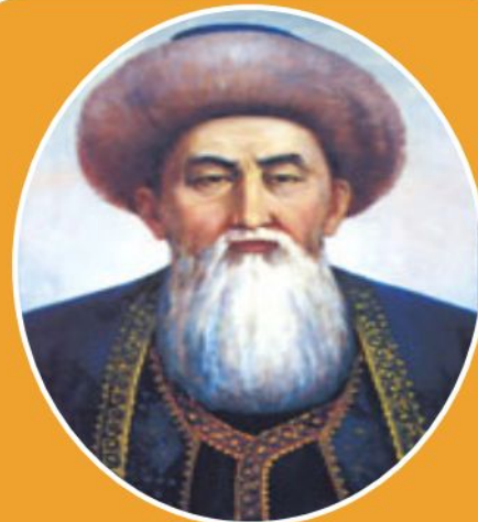
Алшын Әйтеке би