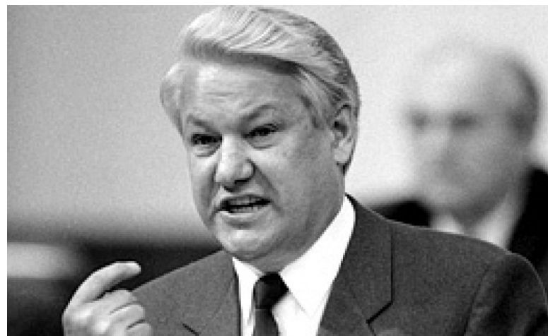
Борис Николаевич Ельцин

Перевесом всего в 4 голоса победу одержал Ельцин . Он стал Председателем Верховного Совета РСФСР