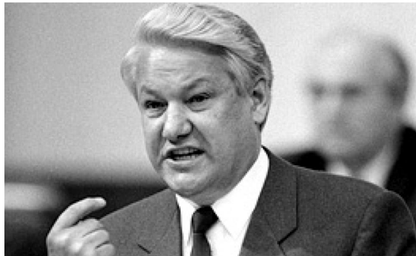
Борис Николаевич Ельцин

На I съезде народных депутатов РСФСР (16 мая - 22 июня 1990 г.) предстояло избрать Председателя Верховного Совета - высшее должностное лицо России