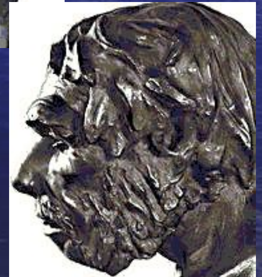
Неандерталец из Монте-Чирчео. Реконструкция М. М. Герасимова.