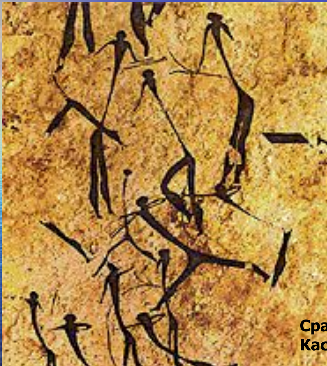
Сражающиеся лучники. Кастильон. Испания.