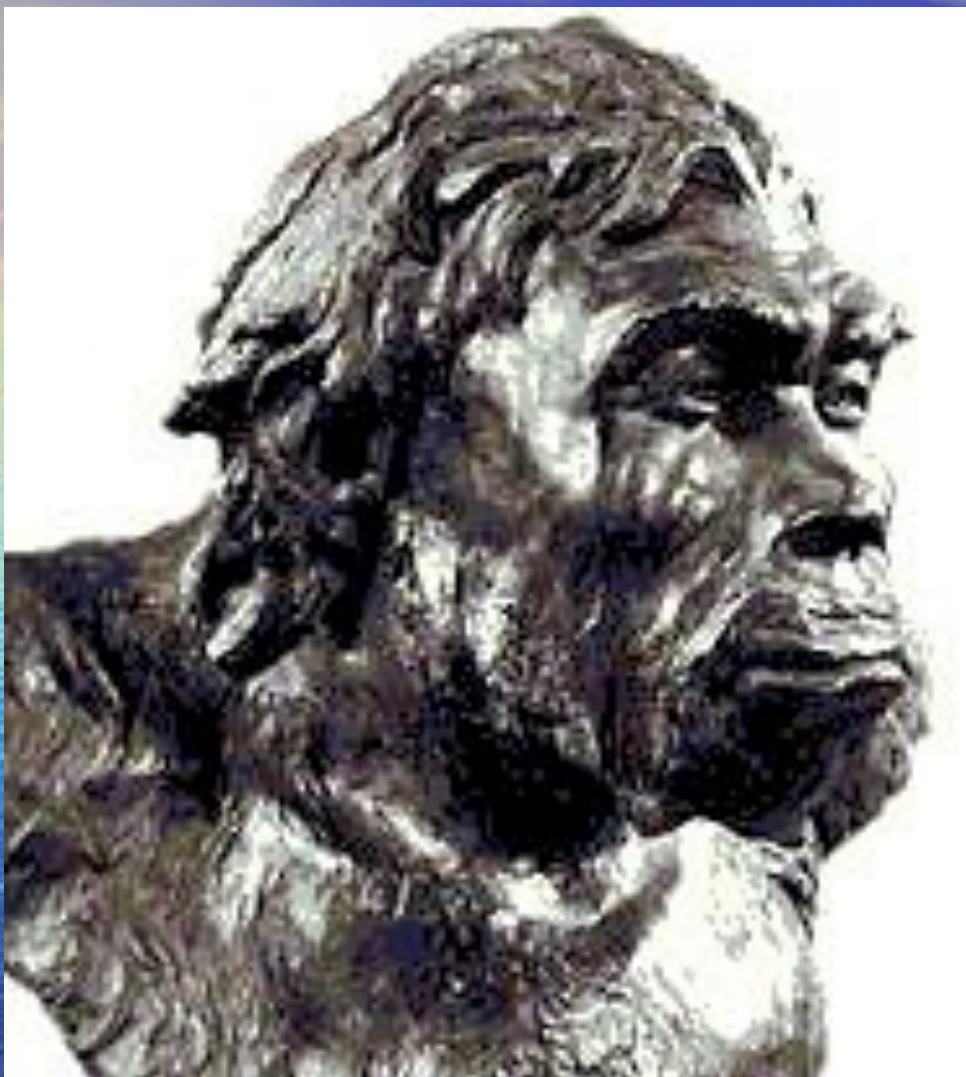
Синантроп. Реконструкция М. М. Герасимова. 1938. Музей антропологии МГУ им. М. В. Ломоносова