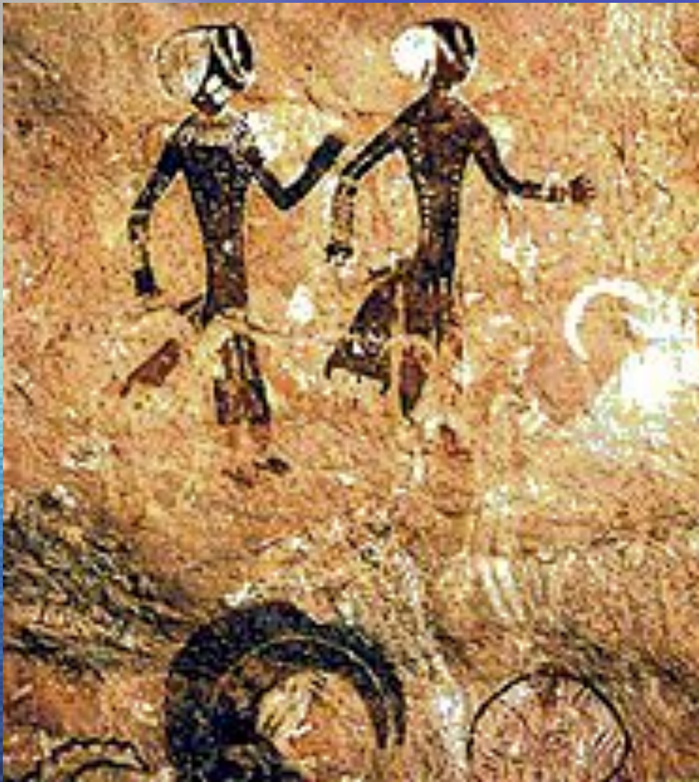
Росписи на горном плато Тассили-Аджер. Алжир