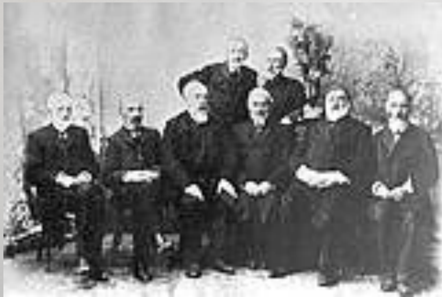
Группа ссыльных поляков в Иркутске. Фото 1890-х гг.

«Сибирь признает и ценит эти заслуги политических ссыльных поляков. Сибирский народ и общество сохранили к ним за это признательность. Сибиряки... провожают их на родину с чувством вполне благожелательным... Мы, прощаясь с ними, готовы братски пожать их руки и пожелать им всех благ на родине» (газета «Сибирь» № 81 за 1883 г.)