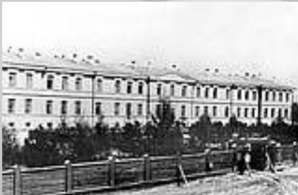
Здание Иркутского военного госпиталя. Фото 1890-х гг.

В 1871 г. А. Чекановский и И. Черский осмотрели котлован, вырытый под новое здание Иркутского военного госпиталя в Знаменском предместье, и нашли, что открыта стоянка каменного века, вошедшая позднее в науку под названием «Стоянка Военный госпиталь».