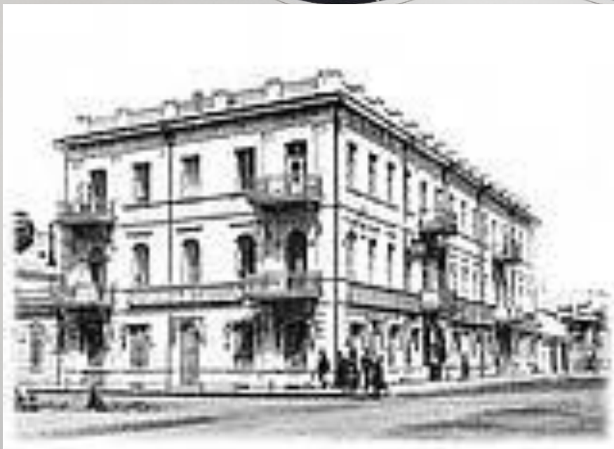
Гостиница «Центральное Деко».