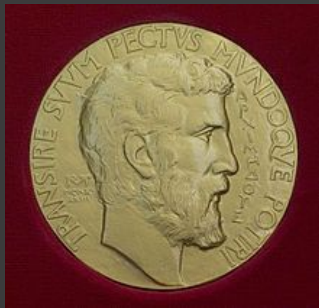
Изображение Архимеда на медали.

Архимед нашёл все полуправильные многогранники, значительно развил учение о конических сечениях, дал геометрический способ решения кубических уравнений. Идеи Архимеда почти на два тысячелетия опередили своё время. Только в XVII веке учёные смогли продолжить и развить труды великого греческого математика.