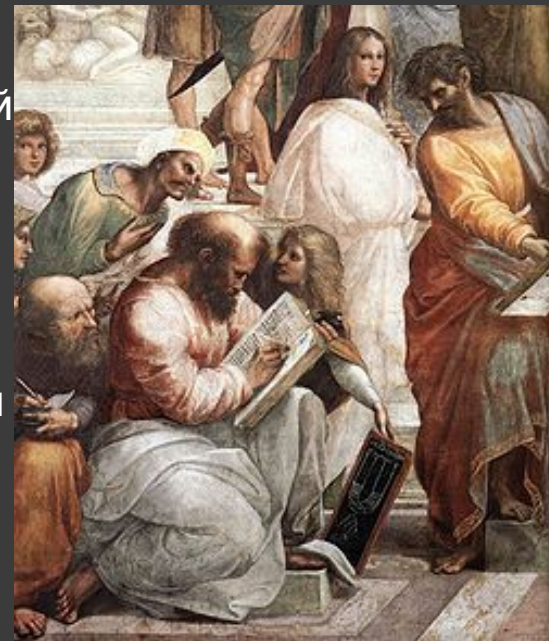
Пифагор на фреске Рафаэля (1509 г.)

Древнегреческий философ, математик и мистик, создатель религиозно-философской школы пифагорейцев. Античные авторы нашей эры отдают Пифагору авторство известной теоремы: квадрат гипотенузы прямоугольного треугольника равняется сумме квадратов катетов. Современные историки предполагают, что Пифагор не доказывал теорему, но мог передать грекам это знание, известное в Вавилоне за 1000 лет до Пифагора. Хотя сомнение в авторстве Пифагора существует, но весомых аргументов, чтобы это оспорить, нет.