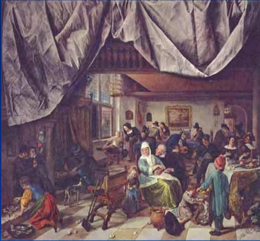
Деревенская ярмарка 17 в.