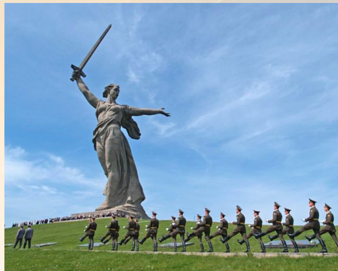
Скульптура «Родина-мать зовёт!»