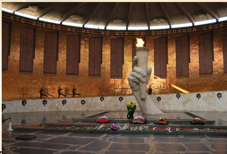
Бечный огонь на мамеевом кургане.

Более 6 месяцев продолжалась битва под Сталинградом, начавшаяся 17 июля 1942 года оборонительными боями советских войск в большой излучине Дона, на рубеже рек Чир и Цимла. Самоотверженно защищая город, советские воины задержали продвижение врага.