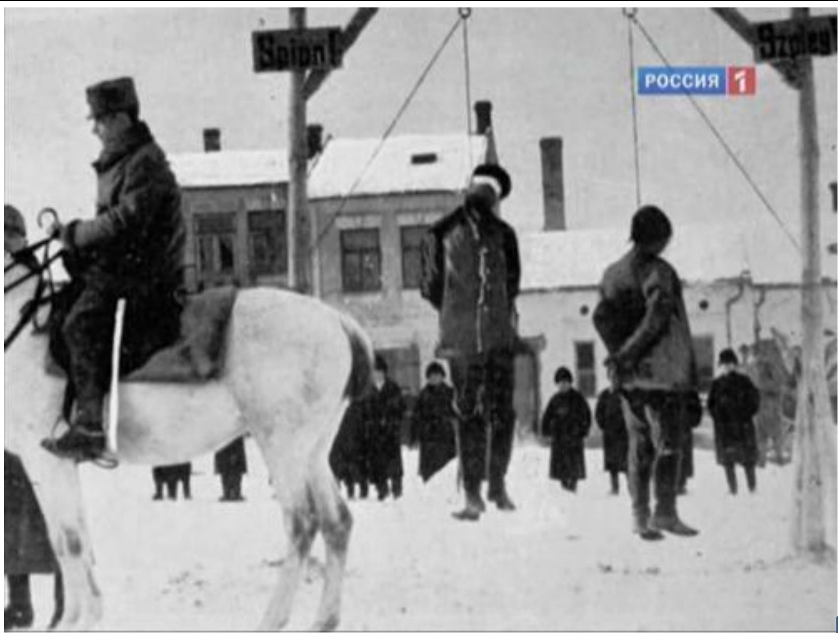
В. Р. Ваврик («Терезин и