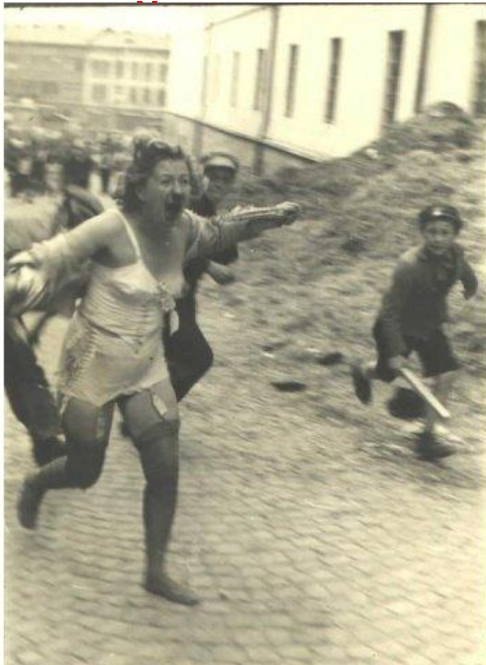
окрестностях Львова семь тысяч евреев.