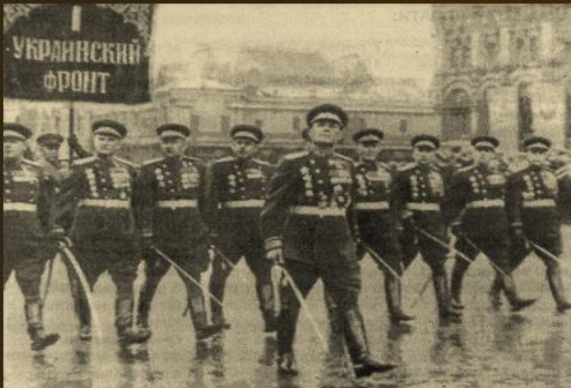
війська 1-го Українського фронту на параді Перемоги в Москві, 24 червня 1945 р.