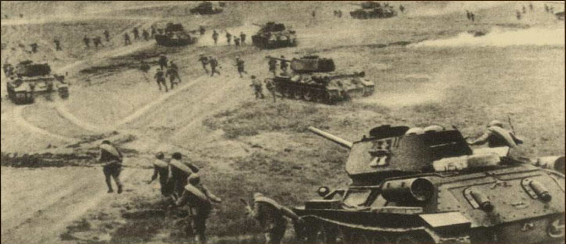
танкова атака на Курській дузі, 1943 р.