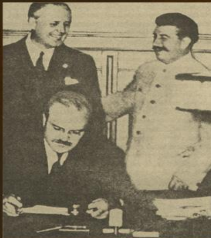
Нарком закордонних справ СРСР В. М. Молотов підписує радянсько-німецький договір про ненапад, 23 серпня 1939 р.