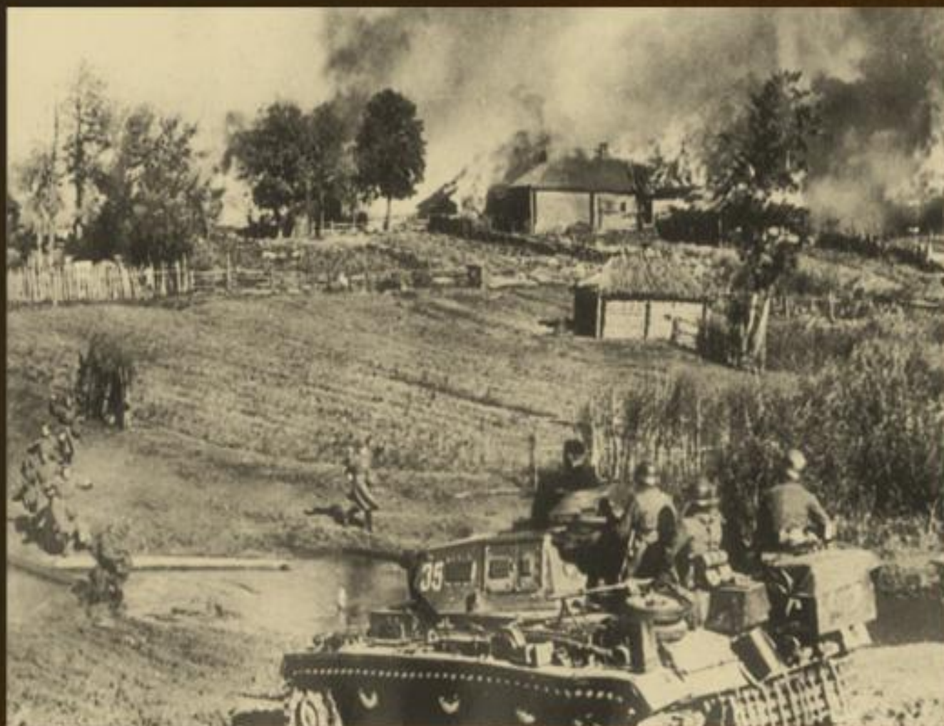
німецький танк в'їжджає в один з населених пунктів України, радянські солдати здаються в полон, жовтень 1941 р.