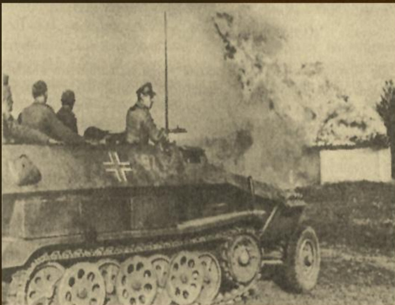
фашистські карателі спалюють українське село, 1942 р.