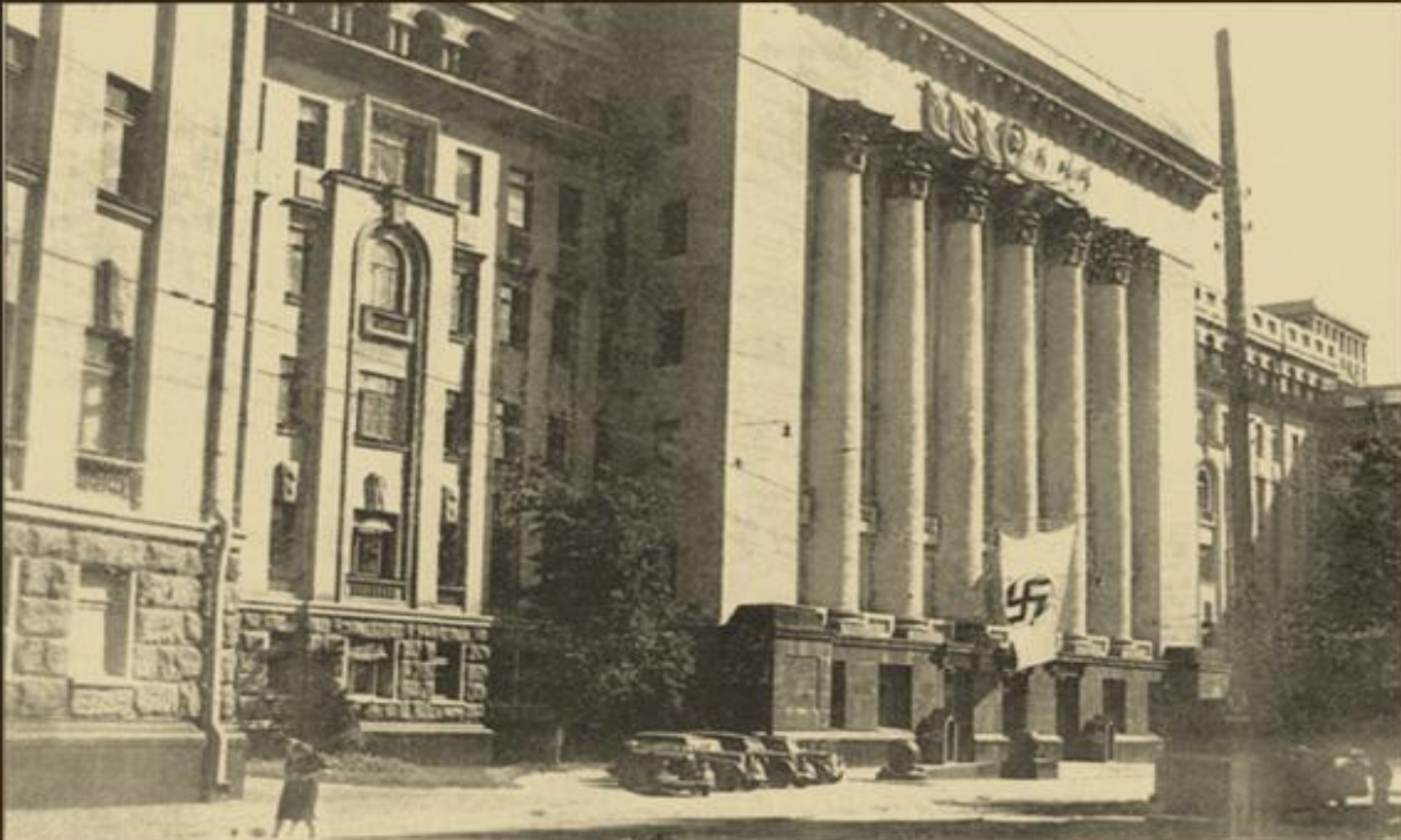
Генералкомісаріат на вул. Банковій, 11 - у колишньому радянському штабі, 1942 р.