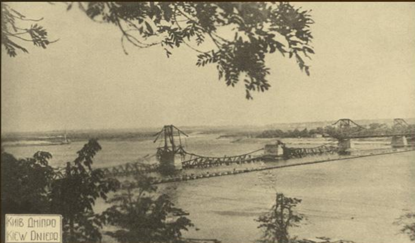
Київ, Дніпро, поштова картка 1942 р.