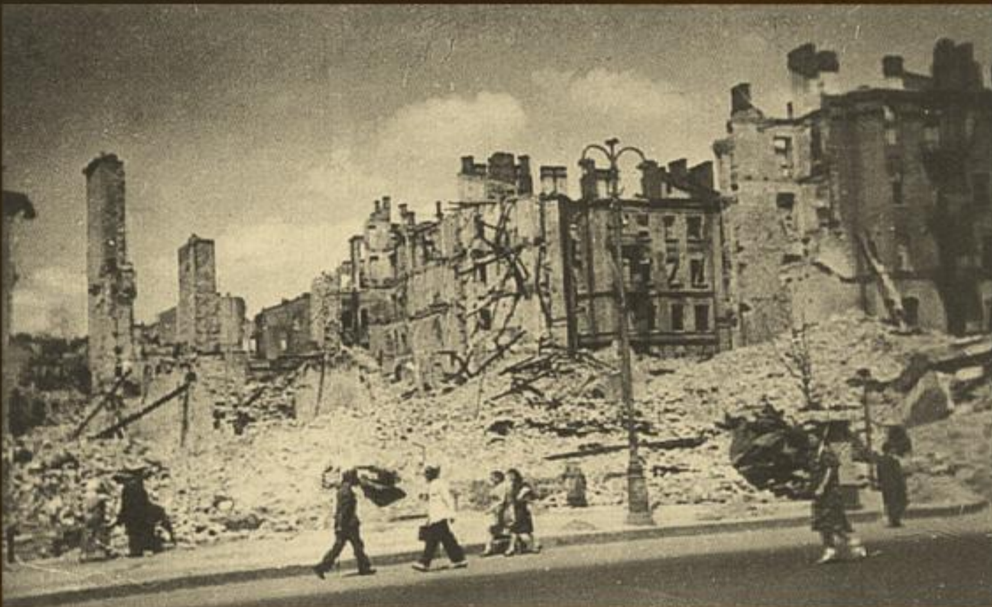
Хрещатик, ріг Прорізної вулиці, 1942 р.