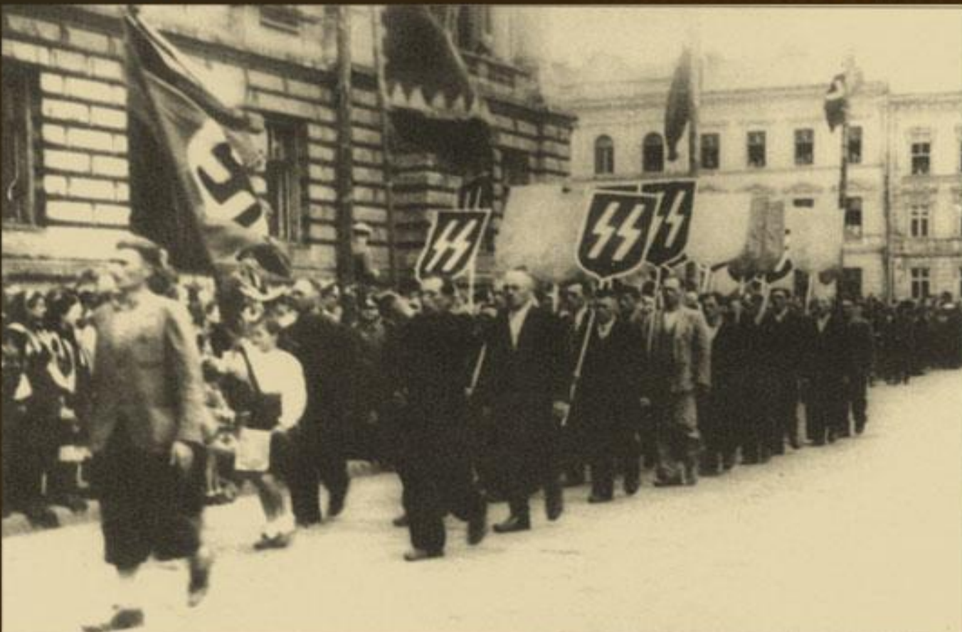
мітинг-парад з нагоди початку формування дивізії СС "Галичина", Львів, 1943 р.