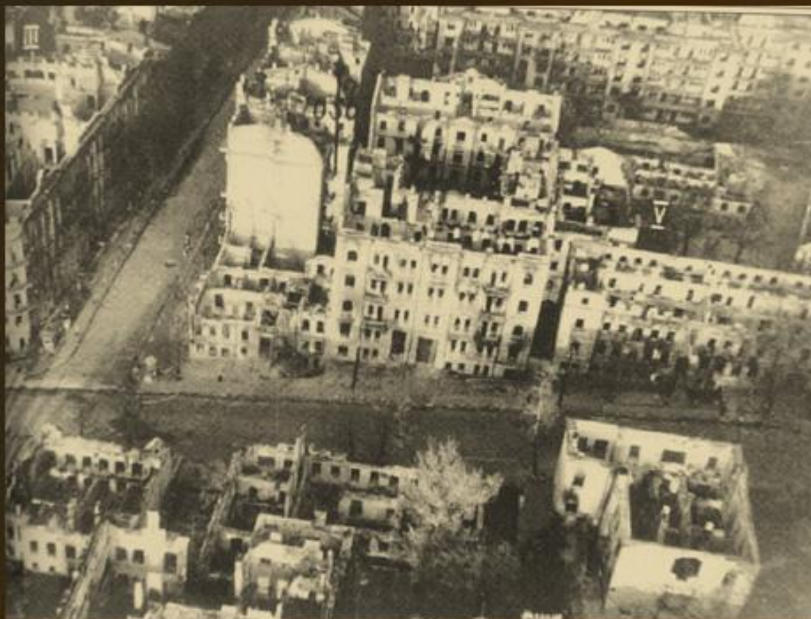
Київ, на розі вулиць Лютеранської та Заньковецької, листопад 1941 р.