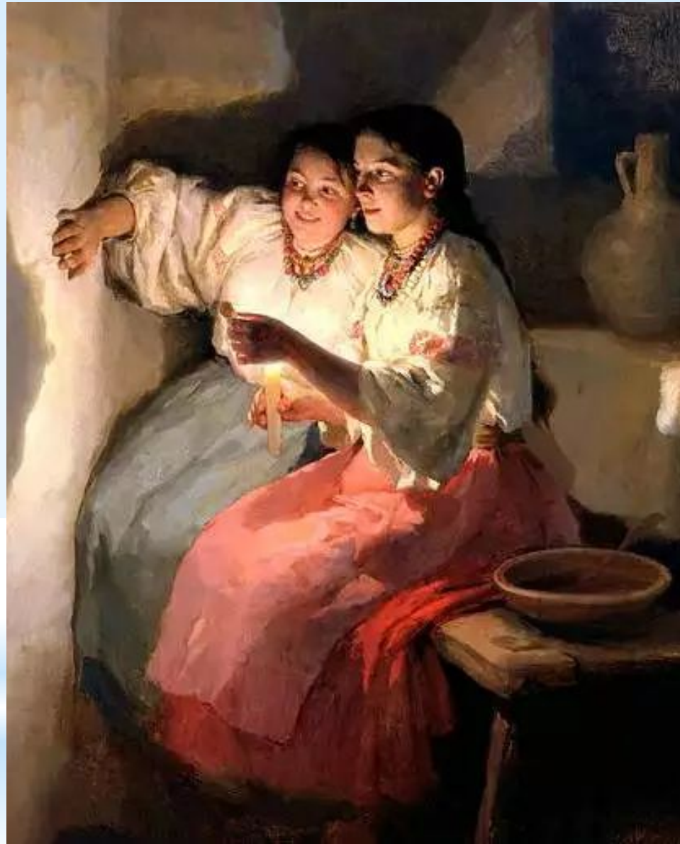
«Святочне ворожіння» 1888 р. М. Пимоненко