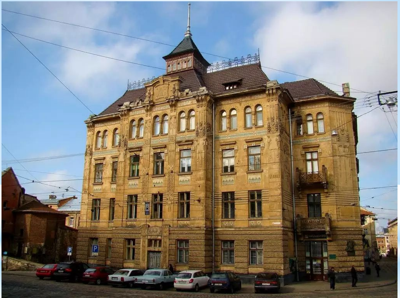
Будинок страхового товариства “Дністер 1905 – 1906 рр.