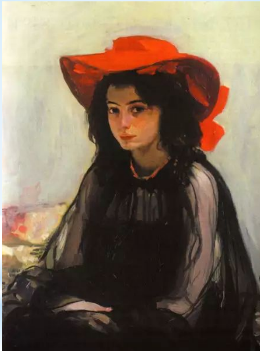
«Дівчина в червоному капелюсі» 1902 – 1903 рр. О. Мурашко