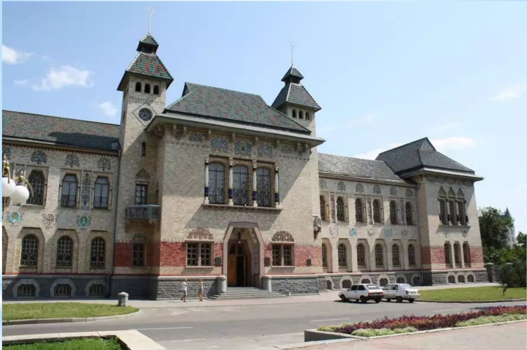
Будинок Полтавського губернського земства 1903 – 1908 рр.