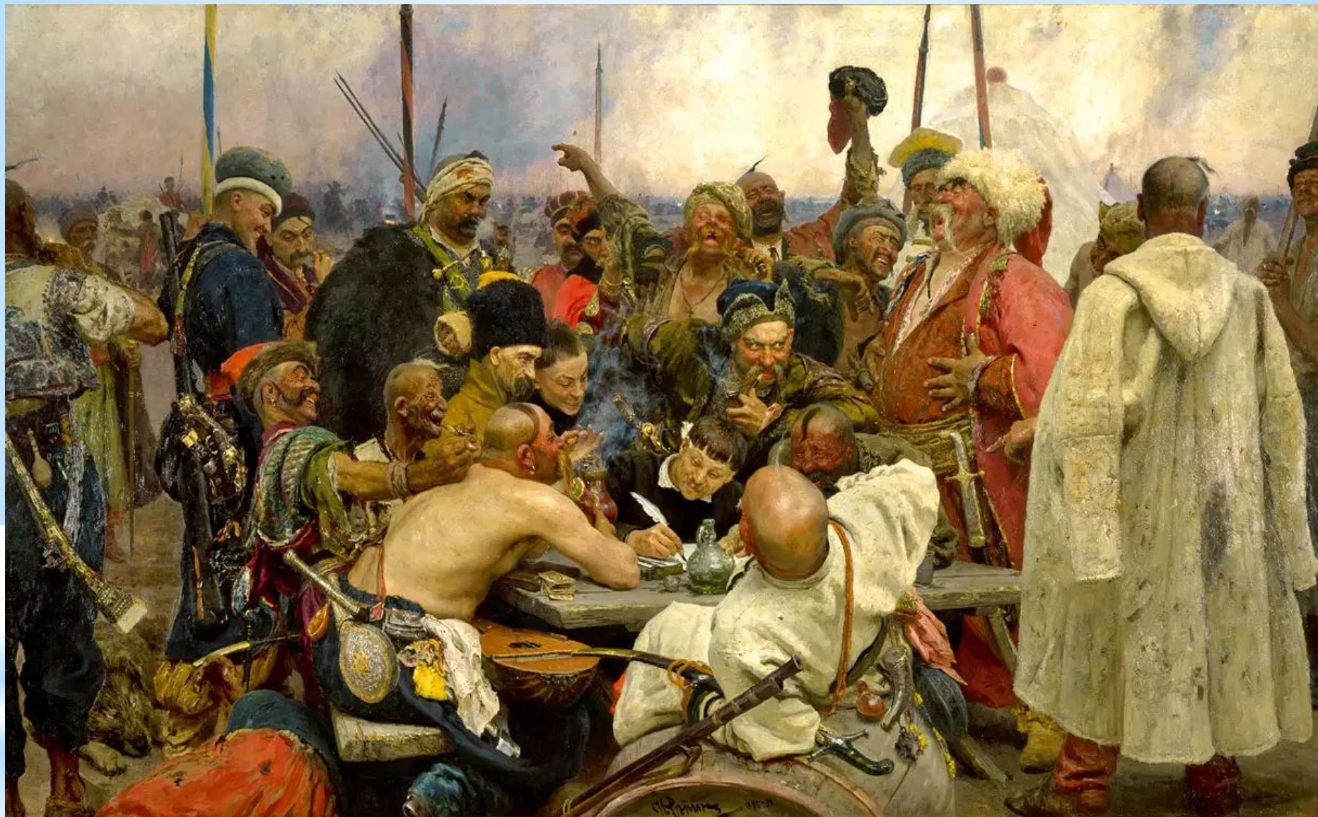
Запорожцы пишут письмо турецкому султану 1880 – 1891. И. Репин