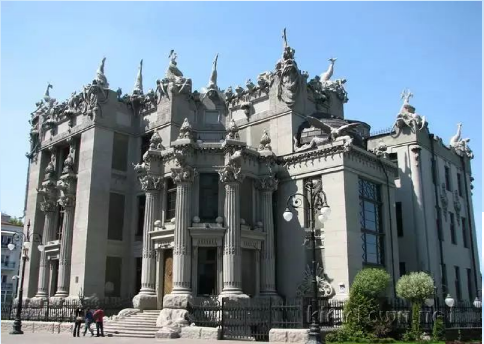
Будинок з химерами 1901 – 1903 рр.