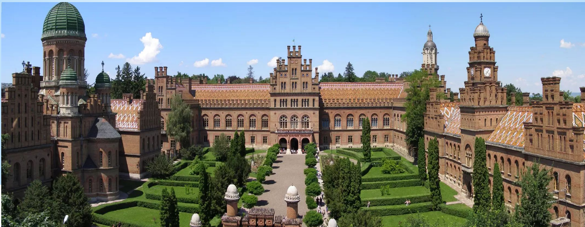
Резиденция митрополитов Буковины и Далмации 1864 – 1873 pp.