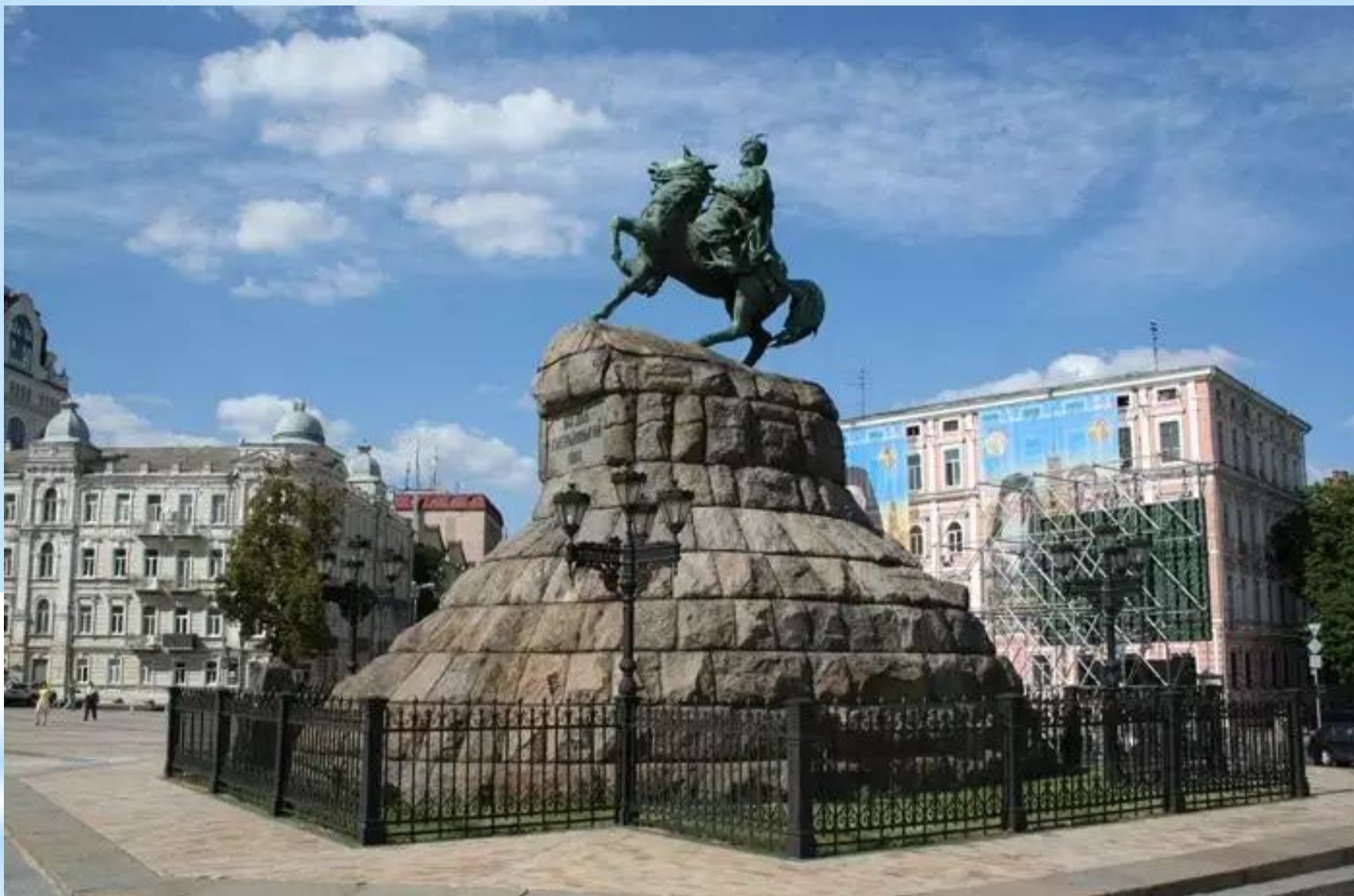
Пам'ятник Богдану Хмельницькому, Київ 1888 р. Скульптор М. Микешин