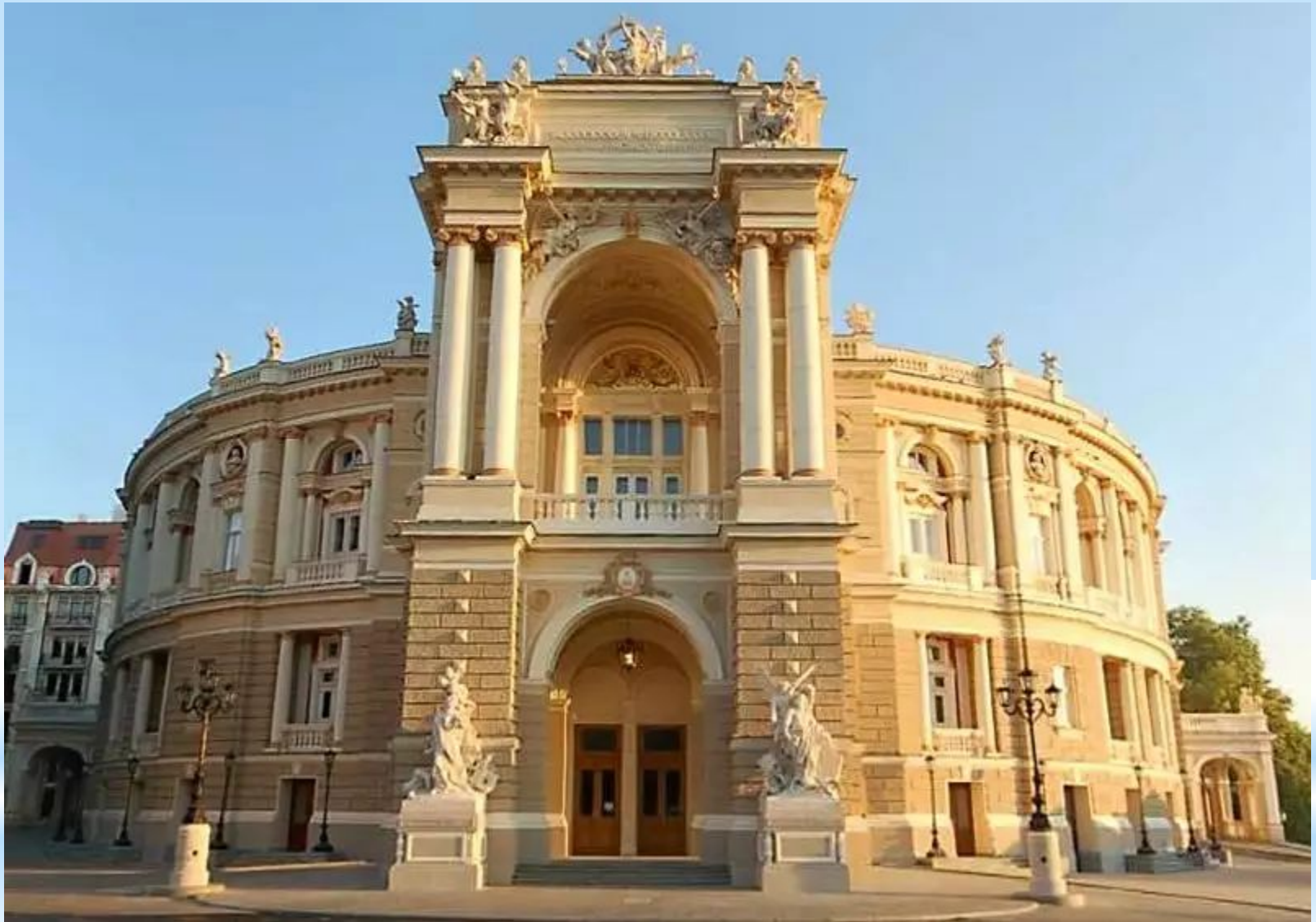
Одесский Театр Оперы и Балета 1883 – 1887 гг.