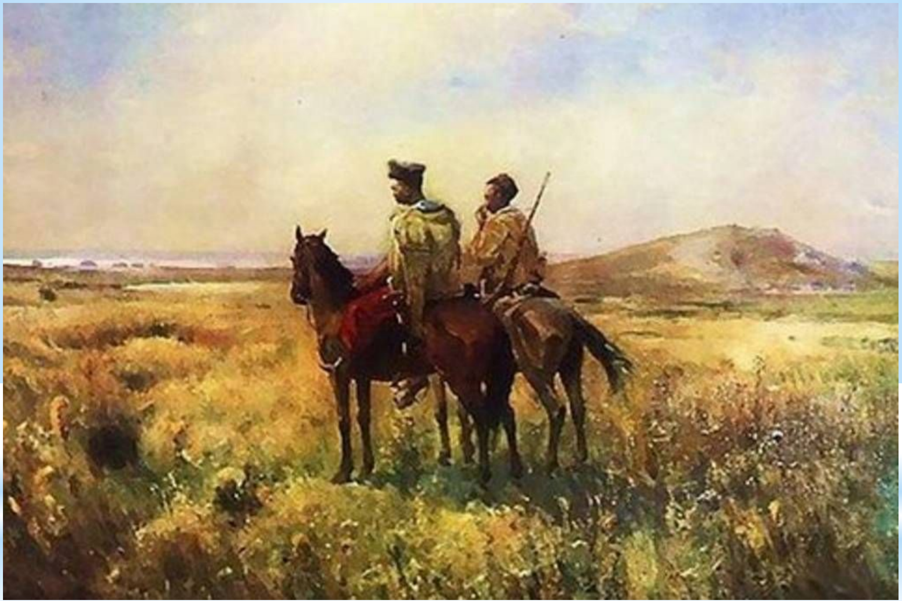
«Козаки в степу» 1890 р. С. Васильківський