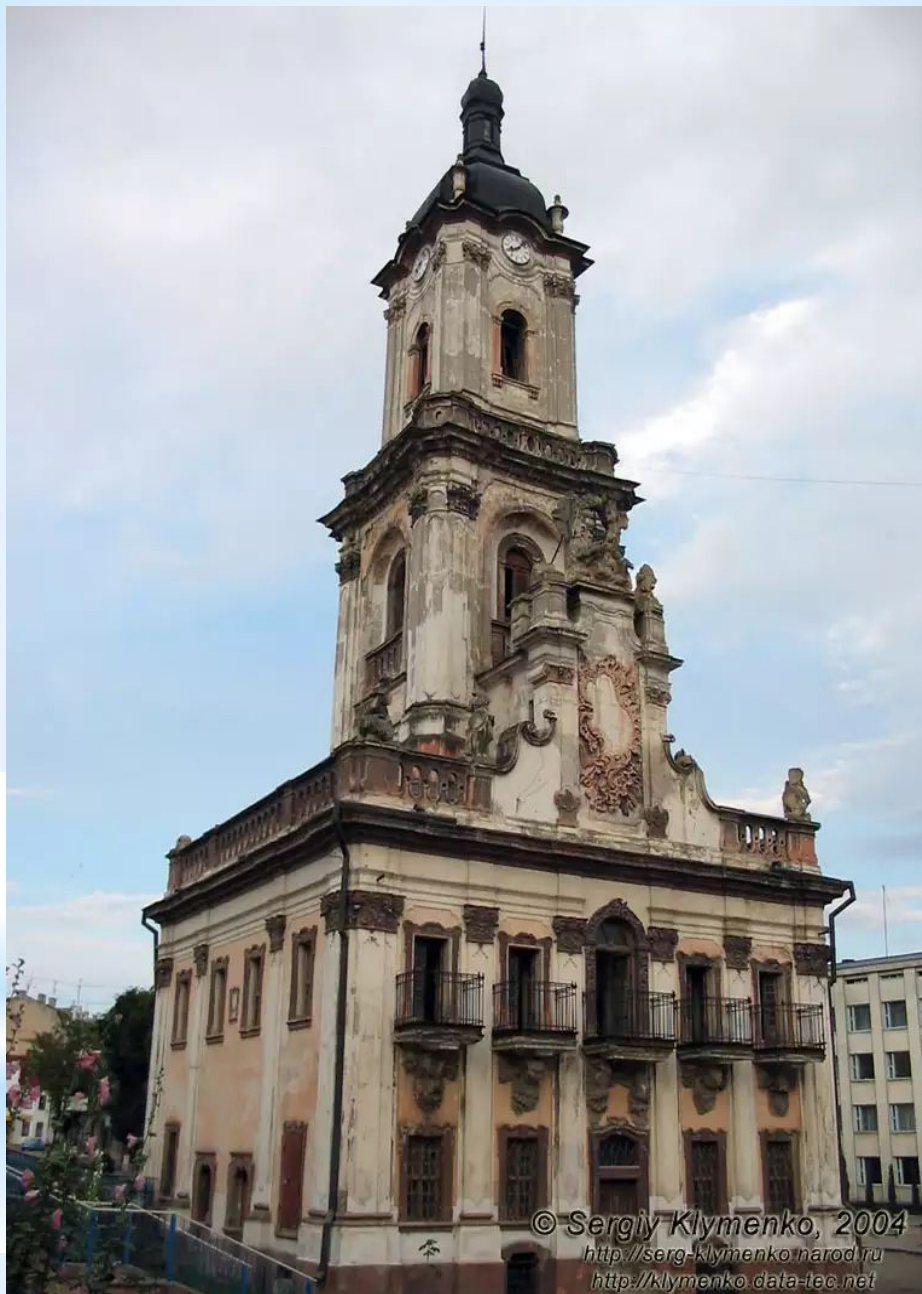
Ратуша в Бучачі. 1751 р.