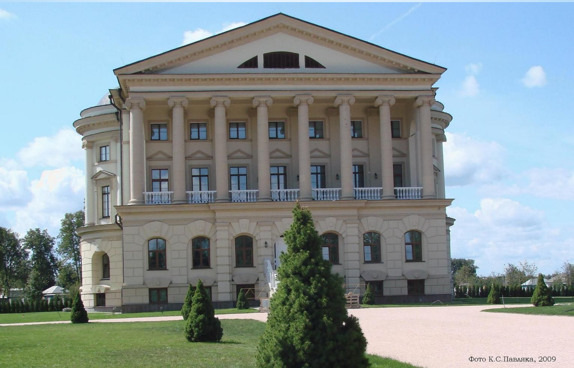
Фото К.С.Павляка, 2009

Палац Кирила Розумовського в Батурині. 1799 – 1803 р.