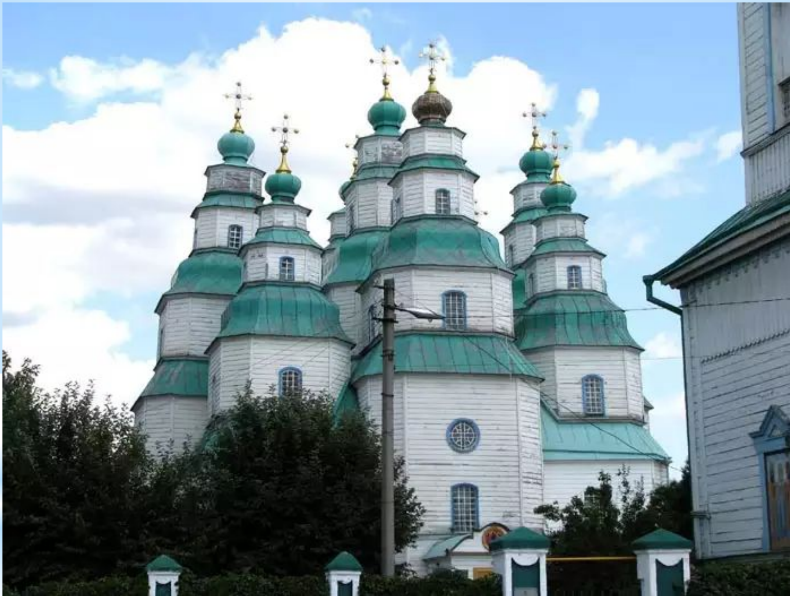
Троїцький собор у Новомосковську. 1773 – 1778 рр.