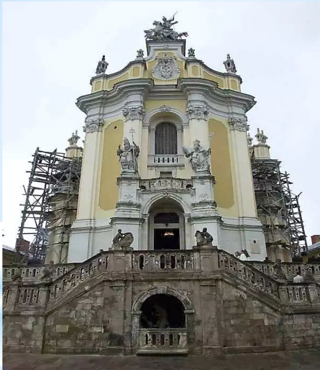
Собор святого Юра у Львові. 1746 – 1762 рр.