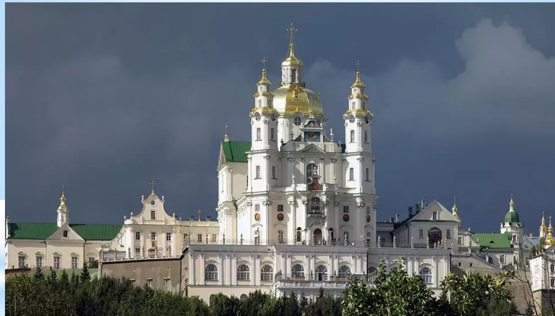
Успенський собор Почаївської лаври. 1771 – 1783 р.