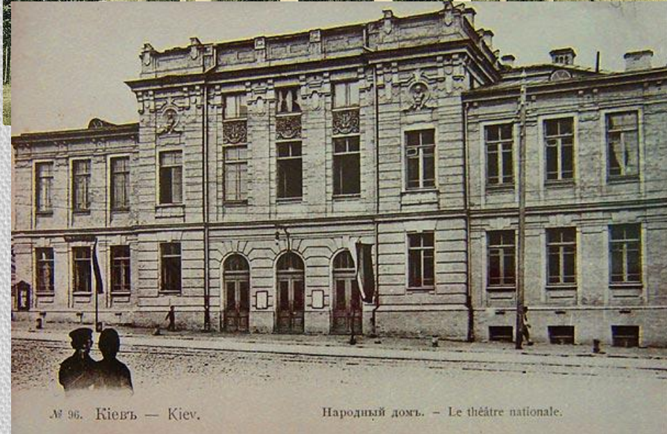
№ 96. Київъ — Kiev.