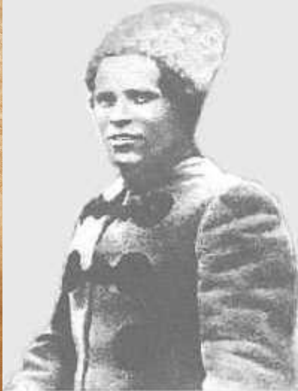
Н.И. Махно, 1919г.

Сам Н. Махно дав назву своєму визвольному руху, на звав його «українською революцією» (обираючи «націоналізму землі» і відкинувши «націоналізм крові»). Махновська «Декларація» звертає увагу на особливість націоналізму «по - гуляйпільські»: «Кажучи про незалежність України, ми розуміємо цю незалежність не як незалежність національну, за зразок петлюрівської самостійності, а як незалежність соціальну і трудову робітників та селян.