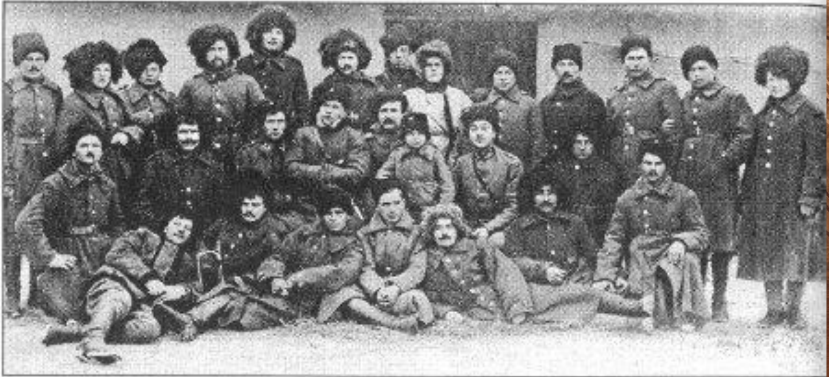
Старшини конвою командарма під час Першого Зимового походу армії УНР

У жовтні 1919 р. махновці створили у липні 1919 р. потужну Революційно-повстанську армію України (склад армії доходив до 80 тис. повстанців, з яких переважна більшість була українцями).