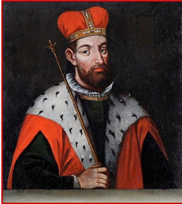
Воображаемый портрет Гедимина. 1709 г.

При великом князе Гедимине в ВКЛ произошло укрепление единовластия. Возросла роль великого князя как руководителя государства. Его титул стал звучать так: «король Литвы и Руси», «король литовцев и многих русских». Под названием «русские» имелись в виду жители прежде всего белорусских земель: Витебской, Берестейской, Менской и Туровской, которые вошли в состав ВКЛ.