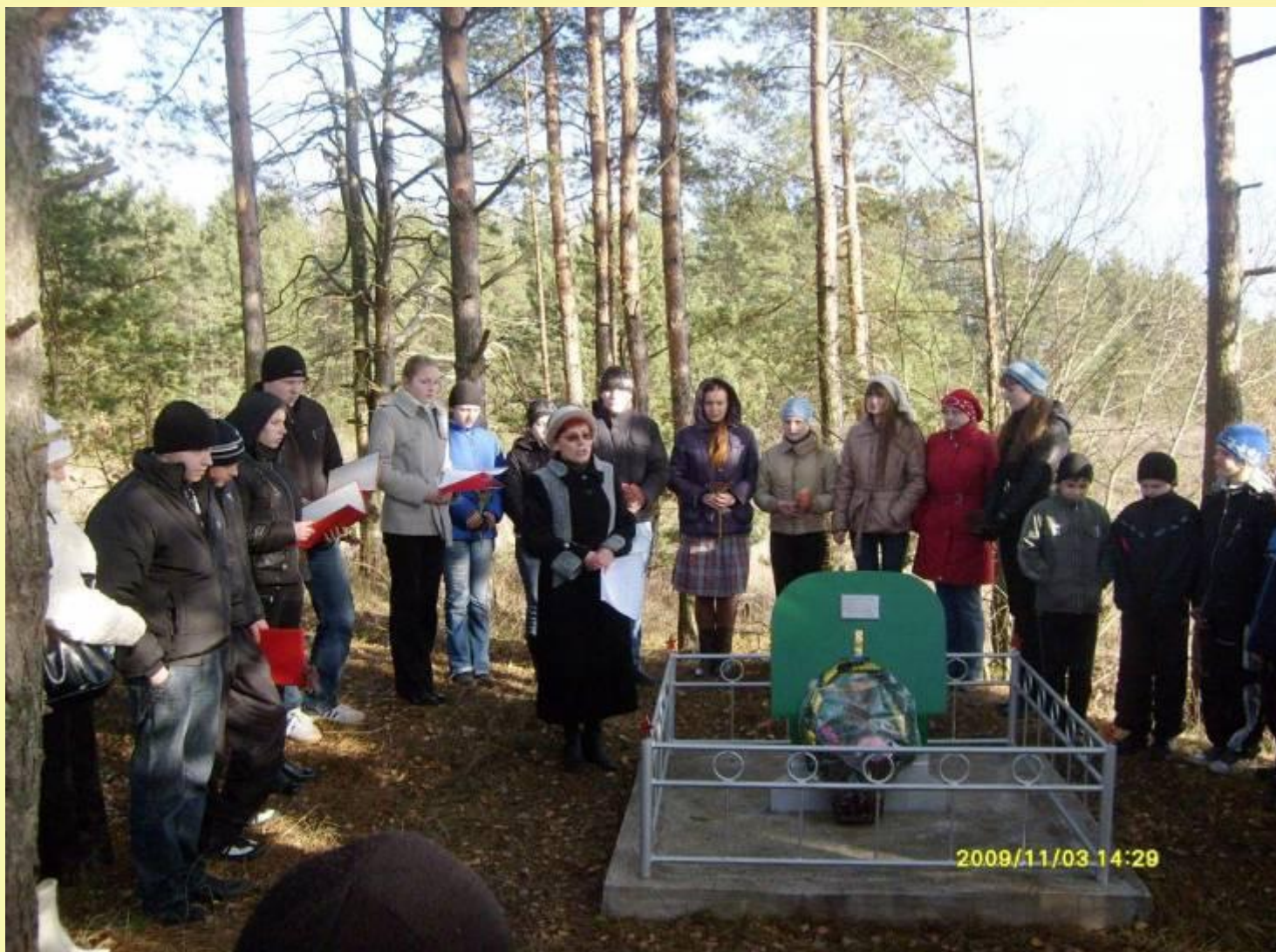
Памятный знак на месте гибели Героя Советского Союза Маншук Маметовой в дер. Заиванье