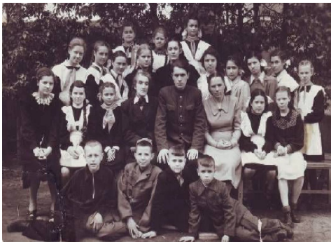
Директор музыкальной школы со своими учениками