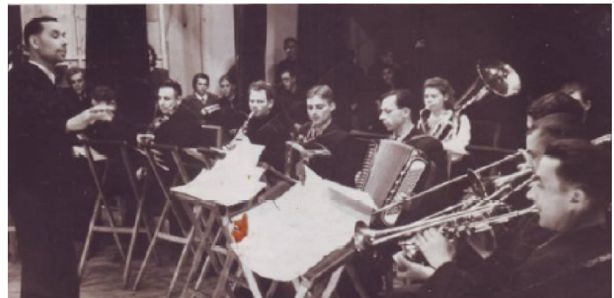
Работа в оркестре