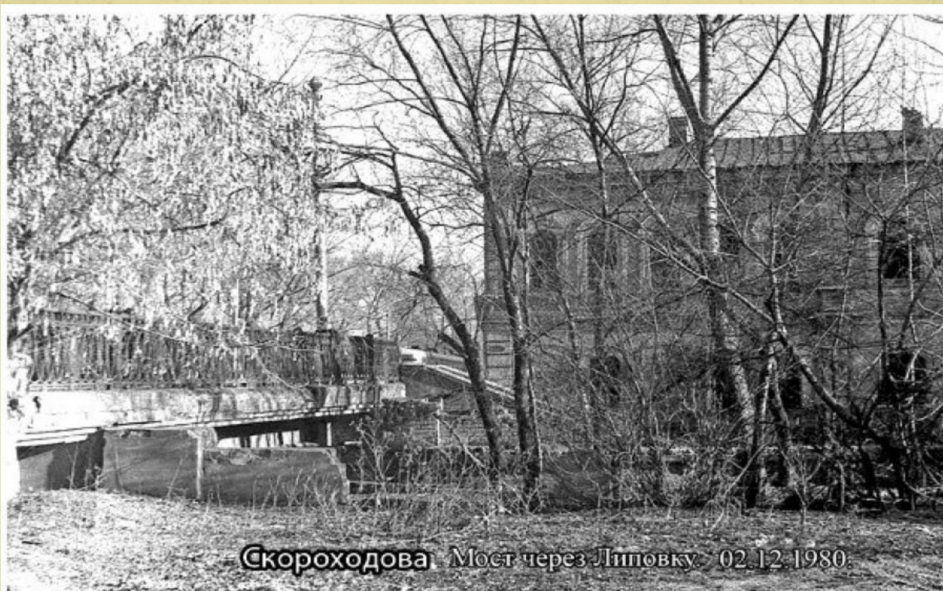
Мост через Липовку. 02.12.1980.