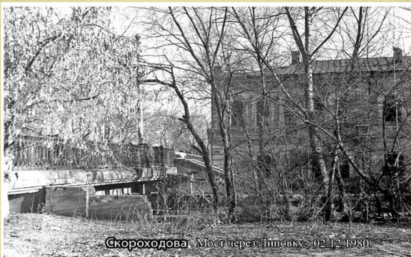
Мост через Липовку. 02.12.1980.