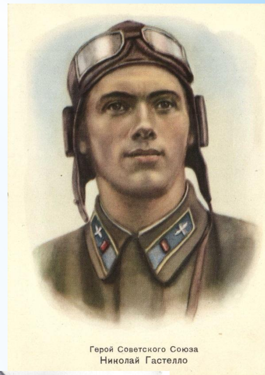
Герой Советского Союза Николай Гастелло

В мирные дни он повторил подвиг легендарного летчика Второй мировой войны Николая Гастелло. 5 мая 1996 года, выполняя специальное боевое задание в Чечне, Игорь Валентинович, как и Герой СССР, направил свой горящий самолет в колонну боевиков.