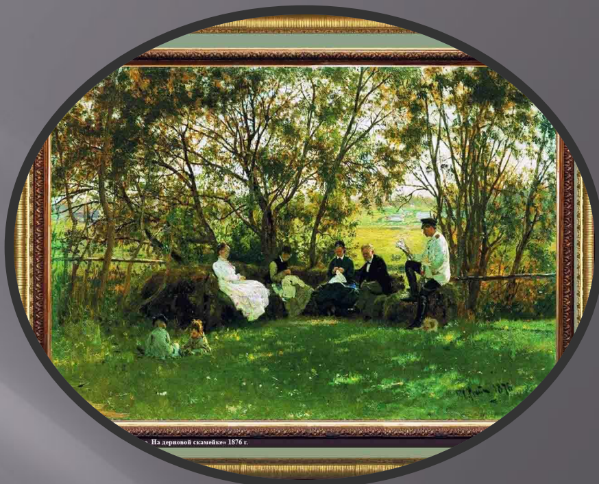
На деревянной скамейке 1876 г.