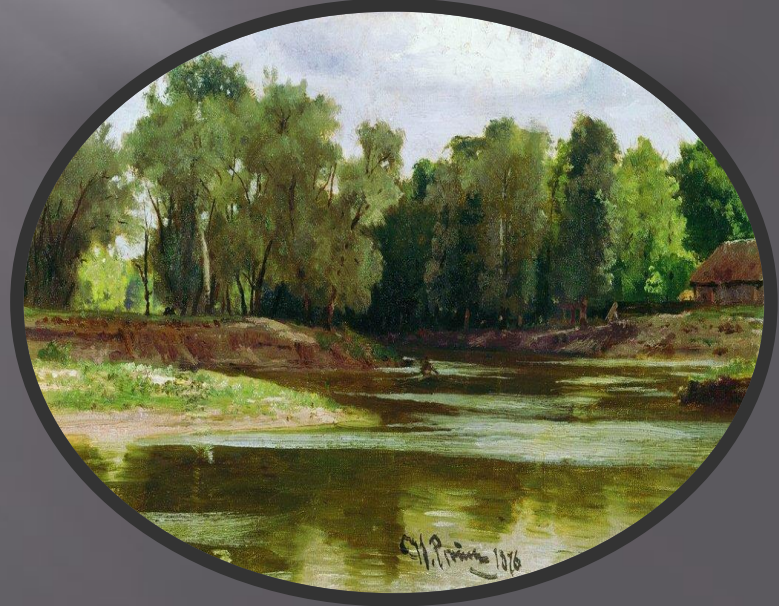
С. П. Писахов 1876