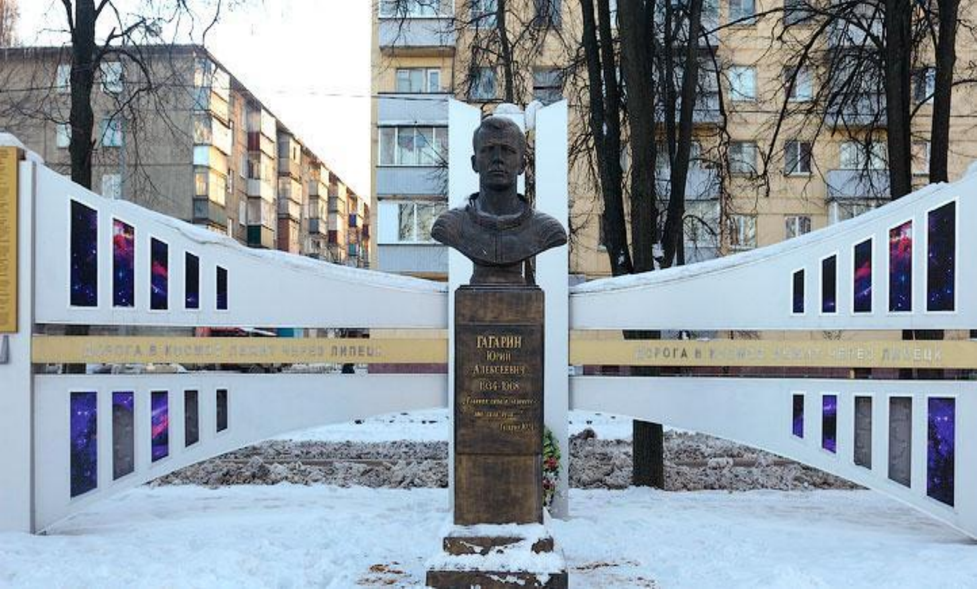
Памятник Юрию Гагарину